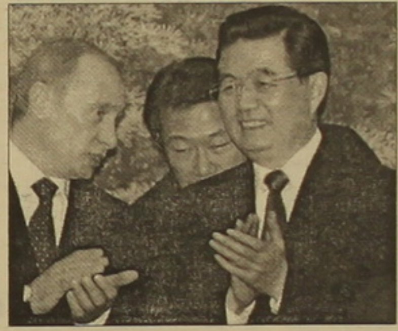
Վիվա Մոսկվայում հոնոբեթը անցկացնելու հարցում:

Տառիկ դարձնելու համար եւ դրանով իսկ նրան հակում է դեռի մյուս աշխարհամասը: Չէր զգացվում, որ Հանիայի համագործակցության կազմակերպության անդամ երկրների լիդերների շարժումը Պուտինը չէր զգում: Երես է, այդ երկրների ոչ մեկը դեռեւ Ամերիկա կամ Գերմանիա չէ, սակայն ասիական հսկայ աշխարհամասն արևալար հեռանկարային է, միավորում է հզոր նյութական ու մարդկային ռեսուրսներ, աչի է ընկնում ճնշման հանդեպ դիմադրող անհատները: Եվ հետո, այստեղ ոչ մեկը մյուսի գլխին բարոյախոսություն չի կարողանում մարդու իրավունքների ու ազատությունների իր «սահմանները» (անհավասար կյանք, օրինակ, որ Պեկինի ֆալաֆալու ճնշում գործադրել Յուի Լուծվող