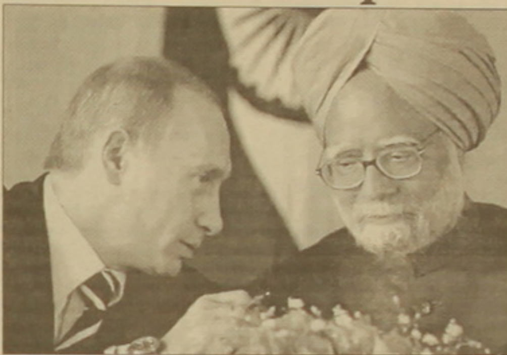
«Ռուսներն ավելի վստահելի են, քան ամերիկացիները»:

Ռուսաստանը Տնդկասանին կմասնակարարի միջուկային 4 ռեակտորների սարքավորումներ: Տնդկասան «Asian Age» օրաթերթը նշում է, որ Դեյլի կառավարությունը գործում է ռուսամետ ազդեցիկ լրբրի, որի անդամների կարծիքով