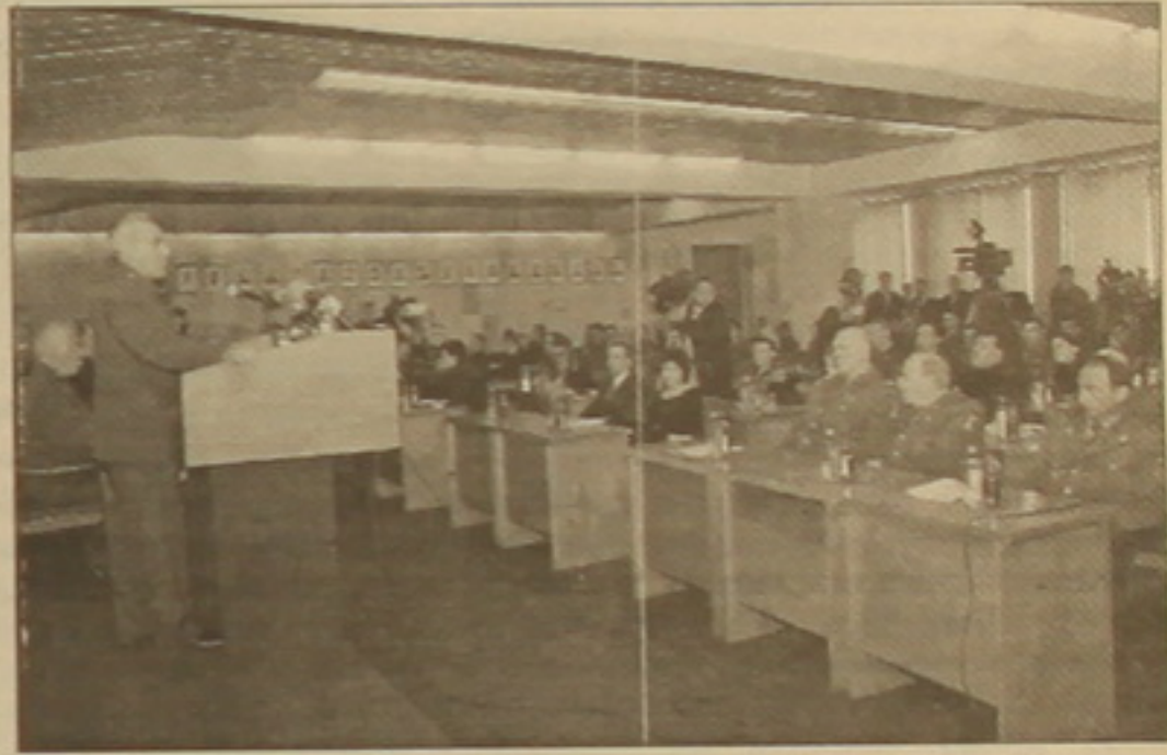
Կանցերին նվիրված 60 կոսր գրականություն: Գիսաժողովի եզրափակիչ լիազումար նիստից հետո խնդրեցի գեներալ-գնդապետ Միխայել Հարությունյանին դասասխատել «Ազգի» հարցերին:

ները անցնեն: Նրանց աշխատավարձերի միջին եւ զգալի սարքություն կա, թեեւ նրանք նույն աշխատանքն են կատարում: ԿԱՐԵՆ ԳՐԱԽԱՆԻՍԵՆ