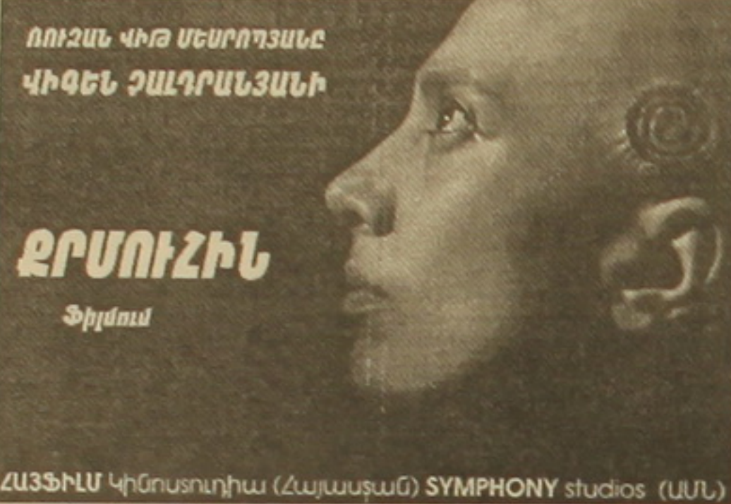
ՀԱՅՏԻՒՆ Կինոստուդիա (Հայաստան) SYMPHONY studios (ԱՄՆ)

Այս ամբողջ բառերն ու խորհրդանշանային ասի առանցքը դեռաֆի գեղուհին, գուշակուհին, ֆրոնտին է՝ սլացիկ, թրթռուն, բնությունը, ոգեղեն ու ընդերային երեսույթներին հաղորդակից, անմիջական ու արատող էություն: Խարանակիր այդ էակը Միհրի հարսնացուն է, որ, ինչպես ամեն մի բնական արարած, ըղձում է արտահայտել իր փթթուն սե-