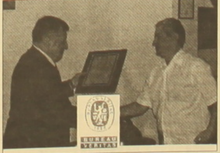
«Trans Alliance»-ը ISO 9001:2000 վկայագիր է ստանում Bureau Veritas-ի կողմից:

BUREAU VERITAS ARMENIA CUSTOMERS CENTRE Tel: (093)340153 www.Bureauveritas.ua