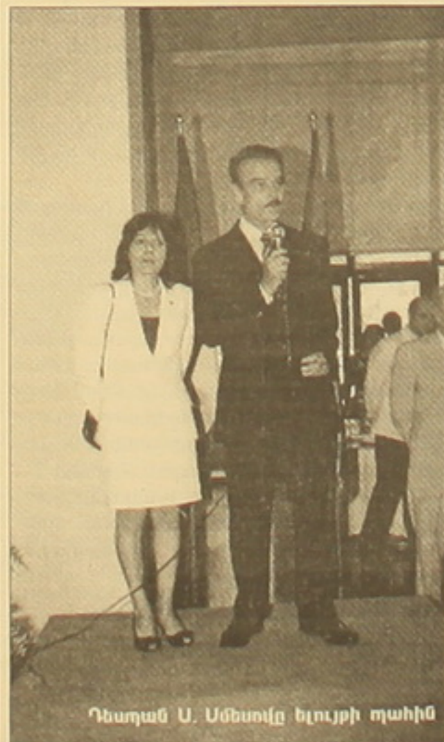
Դեսպան Ա. Սմետսկը ելույթի դահլիճ

1880 թվից ի վեր հուլիսի 14-ը՝ Բասիլի գրավման արեթիվը, նվազում է որոշեալ ֆրանսիայի Հանրապետության ազգային տոն: Այդ օրը, այդ տոնին հանդիսավորություն են հաղորդում զինվորական զորքերը, զորահանդեսների և հրավառությունների տոնական մթնոլորտը: Պատանակված այդ իրողությունը միայն ֆրանսիայինը չէ: Լինելով ժամանակակից կարևոր քաղաք, այն խորհրդանշան է անցումը միապետությունից դեմոկրատիայի հանրապետության և վայելում է համաշխարհային ճանաչում: Այս օրը ես, որոշեալ հայ-ֆրանսիական ջերմ բարեկամության վառ արտահայտություն՝ Երևանի ֆրանսիական դեսպանության աշխատակազմի ղեկավար և տնօրեն փառաբանում հանդիսություն և ընդունելություններ՝ ինչպես Հայաստանի ժամանակակից, դիվանագիտական ու կառավարական քաղաքացիների,