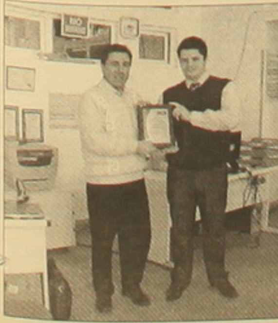
«Norma Plus»-ը ISO 9001:2000 վկայագիր է ստանում Bureau Veritas-ի կողմից:

BUREAU VERITAS GROUP-ը բազմակողմանի կազմակերպություն է, որն բաղկացած է տարբեր ղեկավարման միջոցներից, ինչպես՝ - նավթի ու գազի մակույնը - արդյունաբերություն - սրահայտի եւ հարակից կառույցներ - ֆառաբանական ճարտարագիտություն - միջազգային առեւտր - օդանավակայաններ եւ սիեթեր - գյուղատնտեսություն - կենսաբանություն Ինչպես նաեւ ավելի քան 80 մասնավորեցված ու քաղաքային բնագավառներ: Արդեն Հայաստանում ընկերությունը 2005 թ-ից էլ վեր ծավալում է լայն գործունեություն: Նրա միջոցով ISO 9001 ստանդարտով սերտիֆիկացվել են մի քանի ֆիրմաներ: