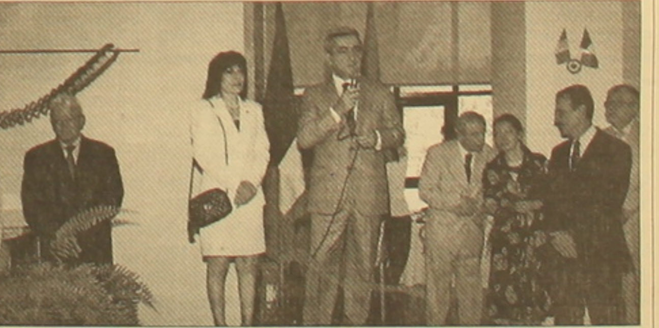
Վարչապետ Սերժ Սարգսյանը ելույթի դահլիճ: Պատանակված արտոնությունից հետո տեղի ունեցավ հյուրասիրություն, իսկ նույն օրվա երեկոյան՝ ելույթներ և ընդունելություններ ժողովրդի ավելի լայն խավի համար: