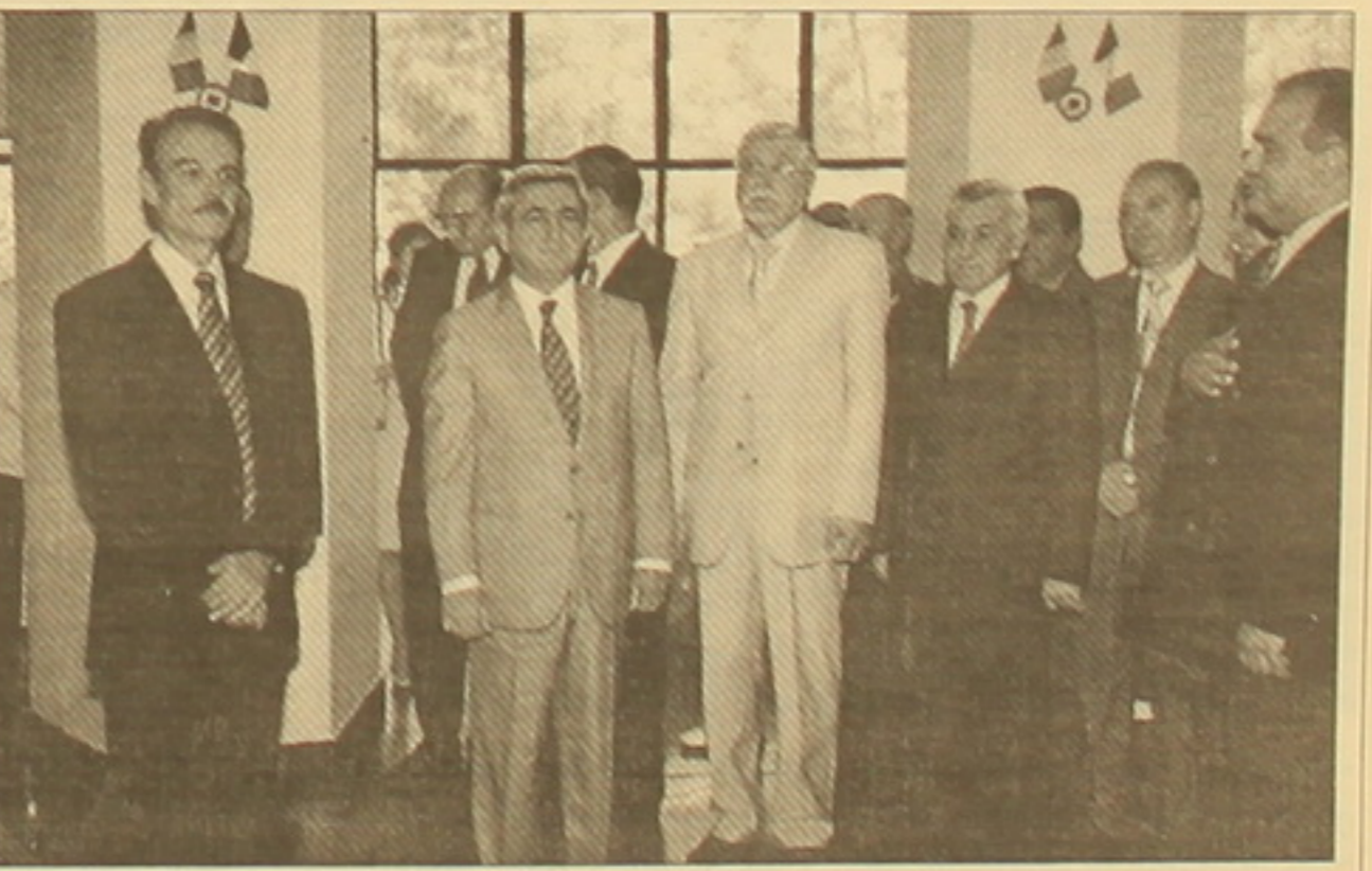
Չախից աջ առաջին շարքի դեսպան Սերժ Սմետսկը, վարչապետ Սերժ Սարգսյանը, Ուկրաինայի դեսպան Ալեքսանդր Բոժկոն, ղապտանության նախարար Սիմայել Հարությունյանը և ղապտանության ԲաՖՖԻ Հովհաննիսյանը երկու երկրների ազգային հիմնադրումից հետո: Հայաստանում ֆրանսիայի դեսպանատուն, 14 հուլիսի 2007 թ.

այնպես էլ ժողովրդի ակամավոր ներկայացուցիչների համար: Պատանակված հիմնադրումից հետո՝ Փարիզից, Զոչարյան-Սարկոզի նախագահական հանդիպումներից նոր վերադարձած ֆրանսիայի Հանրապետության դեսպան Սերժ Սմետսկը, ՀՀ վարչապետ Սերժ Սարգսյանի, ժեսական և դիվանագիտական քաղաքացիների, հյուրերի ներկայությամբ հանդես եկավ հայ-ֆրանսիական բարեկամությունն առավել զարգացնելու, սարսնաբարձրանում խաղաղության ու բարգավաճման կայացման կոչով, որի համար ֆրանսիան, Եվրոմիության ու միջազգային քաղաքացիների հետ կարևոր ջանքեր է գործադրում: Դեսպան Սերժ Սմետսկը մասնավորապես ասաց. «Ֆրանսիական հեղափոխությունը նախանցեց խզում նախկին վարչակարգի հետ՝ մարմնավորելով հույսն առ ավելի արդար հասարակարգ: Երբ բառեր՝ ազատություն, հավասարություն, եղբայրություն, մարմնավորում են այդ իդեալը: Եղբայրություն բառն այսօր ունի ժամանակակից հոմանիշ՝ համերաշխություն, որը լավագույնս է բնորոշում հայ-ֆրանսիական հարաբերությունները: Այս օրը նախաձեռնված էր Բաղրաբանական և մշակութային առումով՝ նկատի ունենալով ուր ամիսների ընթացքում երկու երկրների նախագահների երբեք հանդիպումները և Հայաստանի սարին ֆրանսիայում, իրողություն, որը հնարավորություն սվեց ամրապնդել և վերահասակել բարեկամական խորը կապերը երկու ժողովուրդների միջև: Ֆրանսիայում Հայաստանի սարին ավելի քան հինգ հարյուր հազար ֆրանսիացիների համար հնարավորություն դարձավ՝ վերագրվելու սեփական արժանիքներ և սասնյակ հազարավոր ֆրանսիացիների, ինչպես նաև նրանց օտարերկրա հյուրերի համար՝ ճանաչելու և նորովի բացահայտելու Հայաստանը»: Պատասխանելով վարչապետ Սերժ Սարգսյանը շնորհակալություն հայտնեց