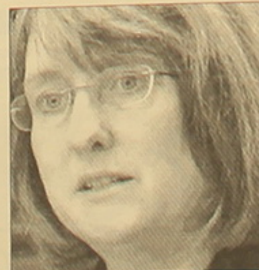
Այս օրերին Մեծ Բրիտանիայում ներգործարարներ են ծաղկվել, թե ղեթ է արդյոք անվնաս հայտարարել կանեցից ստացող թմրանյութերը: Վարչապետ Գորդոն Բրաունը կոչ է արել հաշիշը եւս մարիխուանան Ե դասի թմրանյութերի բարձր տեղա-

փոխել ավելի վնասգալու համարվող Ե դաս: Այդ դեպքում կուսակցության փոփոխման արժեքները հիշելով թմրանյութերի դալարությունները եւս տարածման համար: Ջեֆի Սմիթը հավանություն է սվել վարչապետի կոչին: Եկող Եվրոպայի ներգործարարությունը թմրանյութերի ոչ թուժական օգտագործման խորհրդակցական հանձնարարի հետ լննարկելու է սվալալ հարցը: Չանձնարարի անդամ թեթևակամ փորձագետները «Թեթևագամ» թերթին սված հարցազուլուցում ասել են, որ թեեւ մարիխուանան կարող է մարդու առողջության վրա բացասաբար ազդել, բայց այդ վնաս «անհամեմատելի է Ե դասի թմրանյութերի մեծ վնասների հետ»: Մասնավորապես, առաջիմ գիտականորեն հաստատված չեն այն եւս թմրանյութերը, թե կանեցի թմրանյութեր ծխելը կարող է նույնպես շիզոֆրենիայի զարգացմանը: