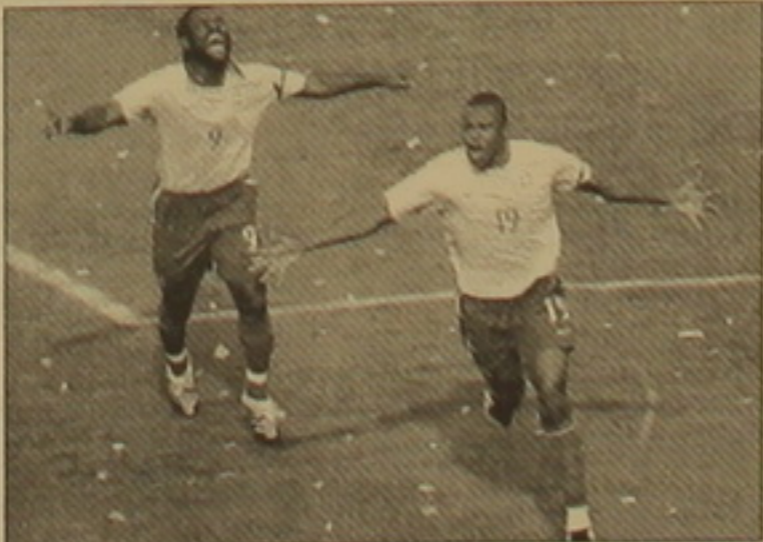
Կու: Երրորդ սեղը գրավեց Մեխիկայի հավաքականը՝ 3-1 հաշիվով հաղթելով ոսրուգլայիցներին:

Ֆուտբոլի Բրազիլիայի հավաքականը երկրորդ անգամ անընդմեջ նվաճեց Ամերիկայի գավաթը: Ինչպես եւ 3 արի առաջ, այս անգամ էլ եզրափակիչում քաղաքացիների մրցակիցն Արգենտինայի ընտրանին էր: Այն ժամանակ քաղաքացիները հաղթել էին 11 մ հարվածաբարով: Այս անգամ աբարիի հնգակի չեմպիոնների առավելությունն ակնհայտ էր: