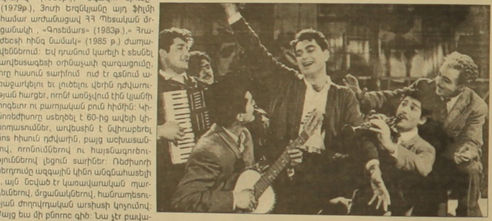
«Առաջին սիրո երգը»

Մի կողմից դա ձգումն է դեղի սեսարայնությանը, վառ կերդարները: Կինոոեծիսորը սեսարանային լուծումներին հատուկ ուտադություն է դարժում «Առաջին սիրո երգը» ֆիլմում (1957թ.), որը այսօր էլ է սիրված եւ սղասված Դաղիսասեսի կողմից, նաեւ «Գայկական որմնակարներ» (1972թ.), «Այդ կանաչ, կարմիր աշխարհը» (1975թ.) կինո-ժաղավեներում: Սակայն, այստես կոչված սեսարանային, վախրանգուլյան լուծումները ոեծիսորի կինոկենսագրության մեջ հատուկ հնչողություն են սանում «Խաթա-