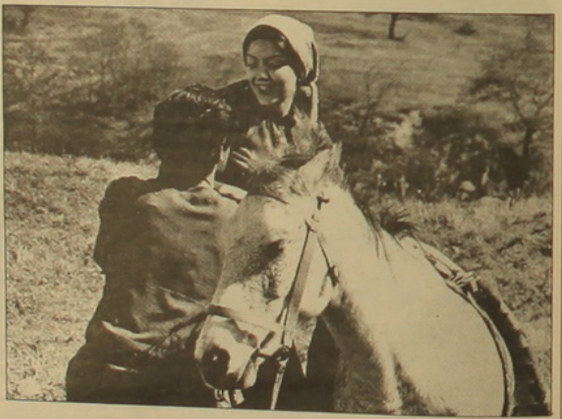
«Այդ կանաչ, կարմիր աշխարհը»

Շատ անումներ այսօրվա մեր ազգային մեակուկում իրենց կայուն սեղն են գրավում: Բավական է թվարկել. ճանաչված կինոոեծիսոր, բազմաթիվ փառասոների դափնեկիր Գարություն հաչարյան, Ազգային ոաղիոյի սնորեն Արմեն Ամիդյան, Գ. Սայանի անվան թատրոնի սնորեն եւ գեղարվեսական դեկավար Նարինե Մայան, բազմաթիվ ֆիլմերի եւ