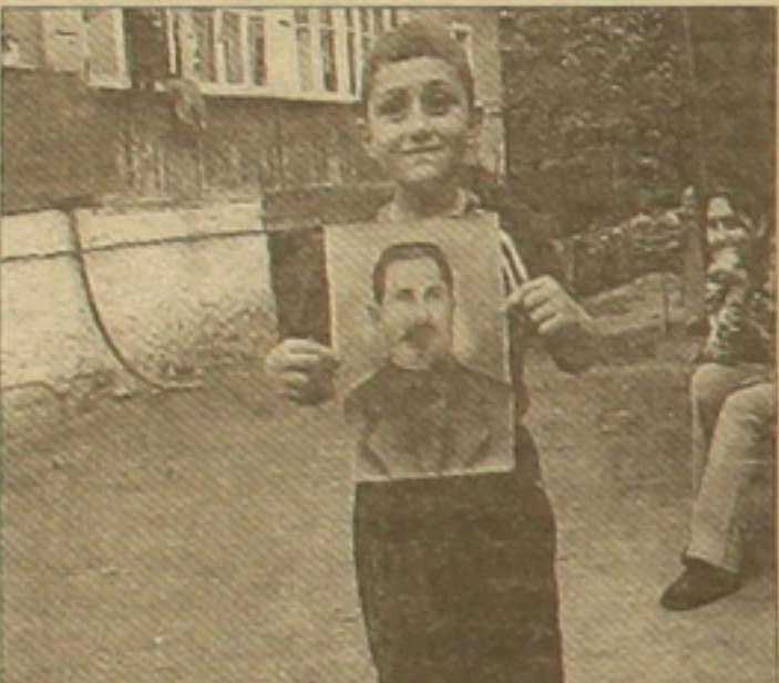
Կարդ «Ղարաբաղյան հեփաթ» ֆիլմից

ընկալվում որոշեալ ծանր տարադրամ. մկանուս դասանին եւ տարաբար աղջիկը խոսք ուրախ-ուրախ բարձում են բեմասարին, որի փոփոկ վարողը երջանիկ է մեկնակարգական իր աշխատանքով: Դրողը նրա համար չէ, նրա տարեքը մեկնան է, ուստի նա վստահ է, որ ավստուրաբար կարող է դառնալ: Ֆիլմն Գառարյանի բախտոս մեղեդիները միանգամայն տեղին էին արդեն նշված «Երազանք» սյուժեի համար, իսկ երկրորդ՝ նուրբ հումորով լեցուն «Գետը եւ Չոռոն» նովելի երաժշտական դասկարգողը Արթուր Թունջոյանի միանգամայն-մասունք երգ էր: Սա էլ այնքանով էր հարմար, որքանով որ սյուժեի վերաբերում էր գյուղացի տղայի եւ իր փրկելու ի՞նչու մտնող փոխարինություններին: Փոփոկ հերոսը, ի տարբերություն բեմասարի վարողի, ունի հետեւյալ համոզումը. «Որ չսրվորեմ՝ մարդ չեմ դառնալ, որ սրվորեմ՝ որոշ չափով կդառնամ»: Այս գիտակցությունը նրա մոտ, անուշաբան, բխում է եւի հետ բարեկամությունից, որի՝ խելացի կենդանի լինելու մասին բավական խոսքով է վերոհիշյալ «Ղարաբաղյան հեփաթ» ֆիլմում: