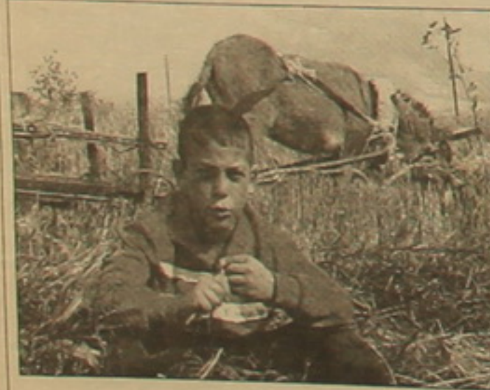
Կարդ «Փոփոկ հեփաթ» ֆիլմից

նովելը հարուցում է նախեառաջ կինոյից դուրս հարցադրումներ: Ինչո՞ւ մի հայկական գյուղում հնարավոր է ստեղծել երջանիկ համայնք, մինչդեռ մյուսում մերձայն գիւղերը բարեկեցիկ են անցած դարերի մեծ դառը ֆրեյմով վասակելով ընտանիքի արտասուք: Ինչպէս են կարողանում հայաստանցի օլիգարխները հանգիստ վայելել իրենց ոսկե արտադրանքները, երբ իրենց ազգակից երեխաները 21-րդ դարում գտնվում են նման սոսկալի վիճակում: «Փոփոկ հեփաթը» աչի է ընկնում երաժշտական ճակատագրի ճեմակործանք: Արամ Խաչատրյանի կենտրոնի երաժշտությունը միանգամայն հարազատ է առաջին նովելին («Վարող»), որտեղ գերիշխում են հովվերգական գույները: Դասային աշխատանքը չի