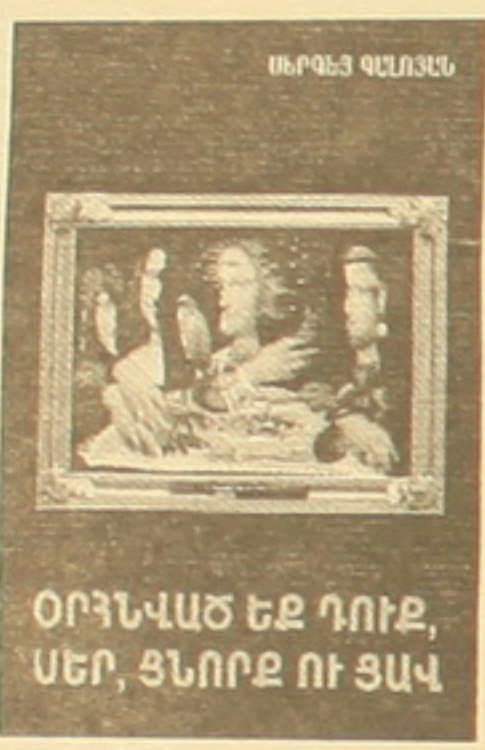
ՕՐԻՆՎԱԾ ԵՄ ԴՈՒՔ, ՍԵՐ, ՑՆՈՐԶ ՈՒ ՑԱԿ

Բոլորը չեն այդպիսին. Օլգա Իվինսկայան, օրհնակ, խմբագրության մի հասարակ աշխատող էր, որ իննագրաբերության ասիճան նվիրվեց ու սիրեց Բորիս Պաստեռնակին: Գե՛տա-