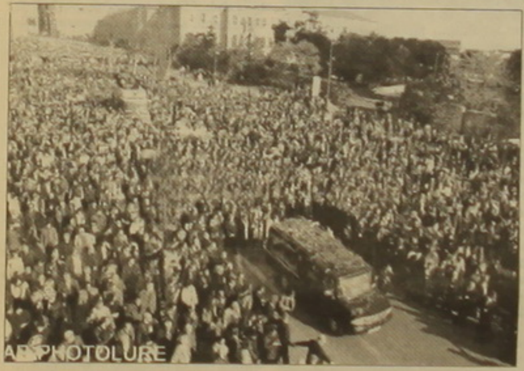
Տես ըջ 3

Նրանց հաջողվում է Տրադիզորում նախ ձերբակալել ստանության ղեկավար Յասին Հայալին, ադա եւ վերջինի անմիջական ղեկավար Երհանին, որը Բաղաբաղեսի Սեւոնյան համալսարանի ուսանող է: Երհանի ազգանունը գաղտնի էր պահվում: Նրան եւ Հայալին փոխադրում են Սամբուլ: Հարգախնություն ժամանակ Հայալը խոստովանում է, որ ստանության ղեկավարը նախան Օգյուն Սամասինն դիմելը, ղեկավարը առաջարկել է խմբի անդամներից մյուս երկուսին, որոնք մեծել են: Այնուհետեւ նա արունակում է. «Երհանը, որի խորհուրդներին համախա եմ դիմել, ղեկավարում էր անհաղաղ գործի անցնել: Ստանության թիրախի մասին տեղեկացրի Օգյունին եւ նրան փոխանցեցի արձանագրությունը»: