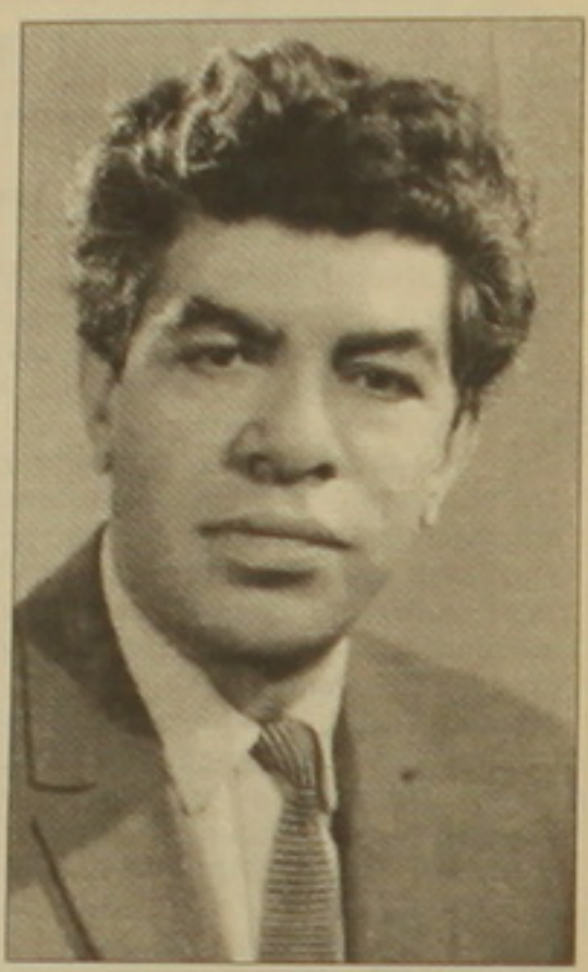
Պարույր Սեւակի մասին ասել է գրվել ու կարվել: Արդեն դասաբան է նաև Սեւակի Գալոյանի նոր գիրքը Պարույր Սեւակի մասին, որն առայժմ լայնաճանաչված է կոչվում է «Պարույր Սեւակ կամ Չուս սովետական սպանություն»:

Ընդհանրապես, Պարույր Սեւակի կենդանության օրով նրա ծննդյան օրը նշվել է հունվարի 26-ը: Բայց ինչպես նշում է բանաստեղծի ազնիվ բարեկամ և Սեւակի մասին առայժմ անգերազանցելի գիտական ուսումնասիրության հեղինակ Ալբերտ Արիստակեսյանը, անընդհատ խոսվելու և ասվել է, որ Սեւակը ծնվել է հունվարի 24-ին, իսկ հունվարի 26-ը եղել է նրա ծննդի գրանցման օրը: Բանաստեղծի բոլոր փաստաթղթերում, ինչպես նաև զանազան կարգի նշումներում, իբրև ծննդյան օր նշված է 1924 թ. հունվարի 26-ը: Բայց «Սայաթ-Նուվան և միջնադարյան ճարտարապետները» անվանումով հրատարակված ձեռագրում, որ բանաստեղծի ամենավերջին ձեռագրերից է, 1971 թվականի հունվարի 24-ի նշումը կողմից Պարույր Սեւակը ասվելագրել է՝ «ծննդյան օրը»: Երբ, ամենայն հավանականությամբ, հունվարի 24-ն է: