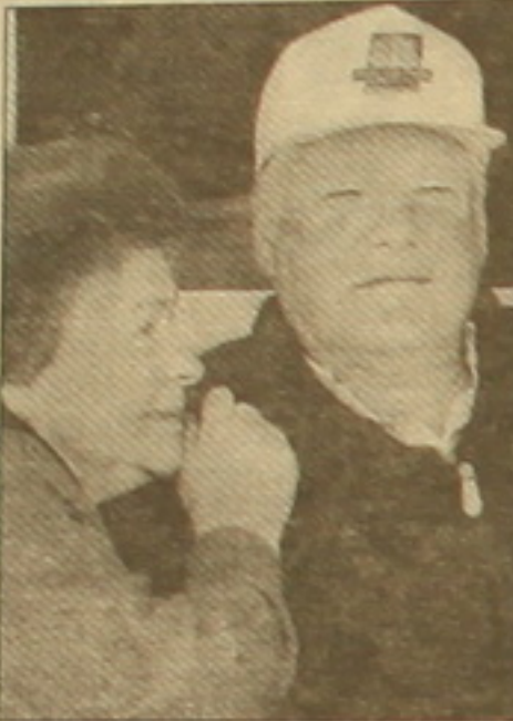
Բորիս Ելցին, Նախնա Ելցինա

Անհայս- Ա. Լեբեդ Անհայս- Մենք տեղեկացվում ենք հաղորդել HTB-ով եւ OPT-ով: Դու՞ր դրանք տեսել ես: Լեբեդ - Ես դրանց մասին չգիտեմ: Ա. - Ես հասկացա: Հավանաբար չի հաջողվել այս գիշեր հանգստանալ... Դե, մեր միակ ղեկավարը հրադրականացում է, այլապես հայրսնի չէ, թե մենք որտեղ կհայտնվենք մեկ