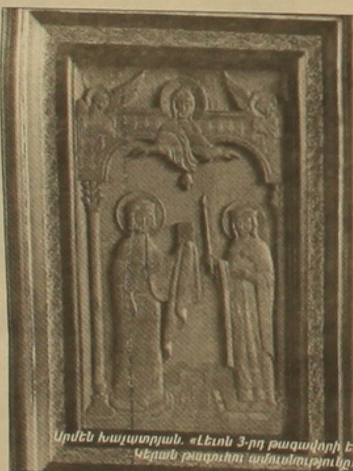
Արմեն Խաչատրյան. «Լեւոն 3-րդ թագավորի եւ Կեղան թագուհու ամուսնությունը»

Արմեն ընտրել է փայտանյութի երկու տեսակ՝ մուգ, երկարակյաց ընկուզենի եւ ժամանակի մեջ համաչափորեն զուսնափոխվող՝ սոխակից միջնաճակ արվեստից սանճեթի: Փայտի բնականությունն ու ջերմությունն օր-օրի կյանքում է նրան, հարազատանում, որին նա նր կյանքում ու նշանակություն է հարդորում, սովորական առօրյակյանությունից փոխադրում հոգեւոր, բարձր ոլորտ: