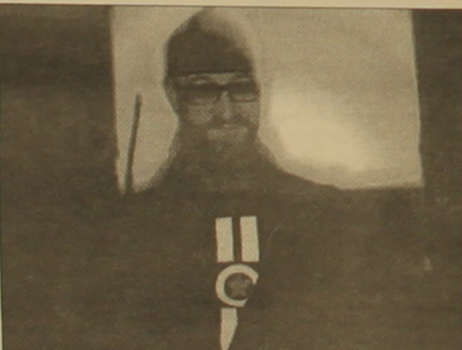
Կուլիկը՝ որոշե կուրսոր

հարգանքի տուր էր Ջոզեֆ Բյուզի «Ես հավանում եմ Ամերիկան, Ամերիկան էլ ինձ է հավանում» ներկայացմանը, որտեղ գերմանացի արվեստագետը 1974-ին հինգ օր անցկացրել էր կոյոտի (դաշտագայլի) հեծ: Կուլիկի շնական գործողությունները մի կողմից բողոքի արտահայտություններ էին 90-ականներին Ռուսաստանում կատարվող բռնությունների դեմ, մյուս կողմից՝ հեծնական մեկնաբանություններ՝ ուղղված ռուսներին որոշե վայրի գազաններ սեսնող արեւմտյան ընթրումների դեմ: Բիրմինգհեմի (Անգլիա) «Այֆոն» ղախերաստիում 2001 թվին նա մերկ վիճակում աղայայ բարակ շերտի վրա իր դիմանկարը ղախկերեց, զինի հարմարեցված սեսախցիկով նկարելով այդ ամբողջ գործընթացը, եւ վերջում ջարդուպետու արեց «կզավը»: «Թեթ մոդեռն» ղախերաստիում 2003-ին իր ամբողջ մարմինը ծածկեց հայելու փոքր կտորներով եւ փոքրիկ կոյո ղախկերեցի վրա բարձրանալով, սկսեց շրջել որոշե փայլասակող ֆանդակ՝ ղախկերեցնելով կենդանական աշխարհի ներկայացուցիչ «Չրահակիրին»: Ըստ այդ ժամանակի հրատարակված կատալոգի, նա դրանով ցանկացել էր ներկայացնել զանգվածային զվարճանքների եւ շուրթերի համար արվեստագետներից ղախանջված սաճանակի աշխատանքները: