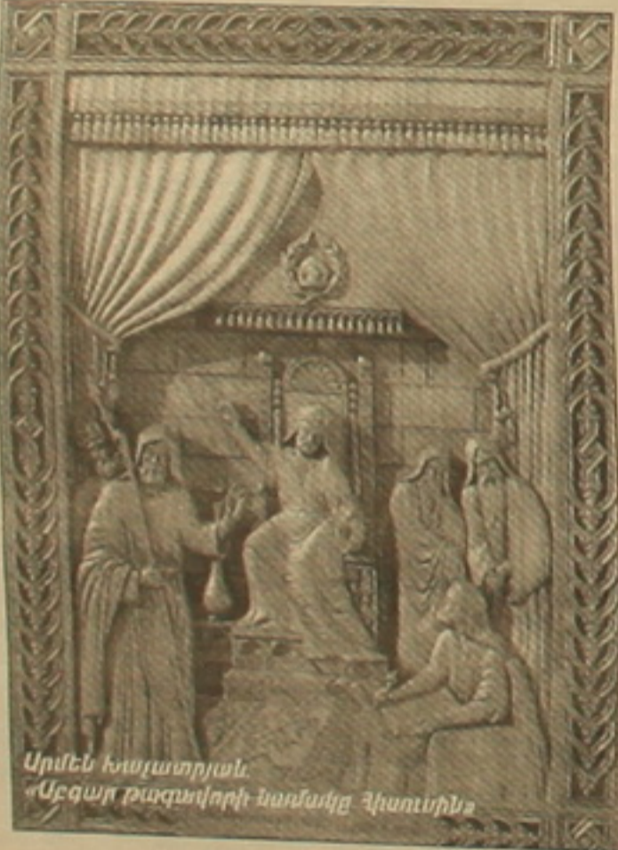
Արմեն Խաչատրյան. «Ազգայնագրական նամակը Հիսուսին»