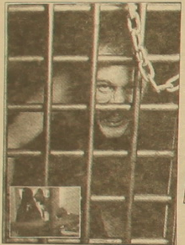
«Ընդը ճաղերի ետևում»: Նյու Յորք, 1997 թ.

Օ լեզ կարծես գտել է իր անդրը: Չսանձված սոփիստիկ մորուսիկ է գլխին՝ ֆազահով ասեղնագործված թասակով նա այժմ նման է մոնդոլական յուրայում իր «մեդիացիոն արաբոլոբլոնը» իրականացնող հոգեբուականի, բոլորովին արքեր արքեր արքեր արքեր արքերի այն «զազազած» շնից, որ Նյու Յորքի «Դիչ Դոգ Եթես» թատերաստի ժամանեց կենդանիներ եղափոխող բեռնասարով եւ ամբողջ երկու շաբաթ վանդակում չորեքսթ սկսեց ամբողջովին մերկ (բացի ճանապարհորդ վզնոցից) վիճակում դես ու դեն վազվզել, հաչել թատերաստի այցելուների վրա եւ նույնիսկ կծել մի արվեստագետ-մանրագիտի կոճը: