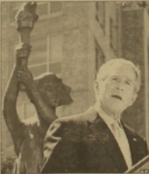
Հուշարձանի հիմնքի վրա կոմունիստական զոհերի հուշարձանը բացվեց:

ԱՄՆ նախագահը երբեմնի «սառը թայյաբ» համեմատել է արմատախիլ իսլամիստների դեմ ներկայումս ընդդիմ թայյաբի հետ, վստա-