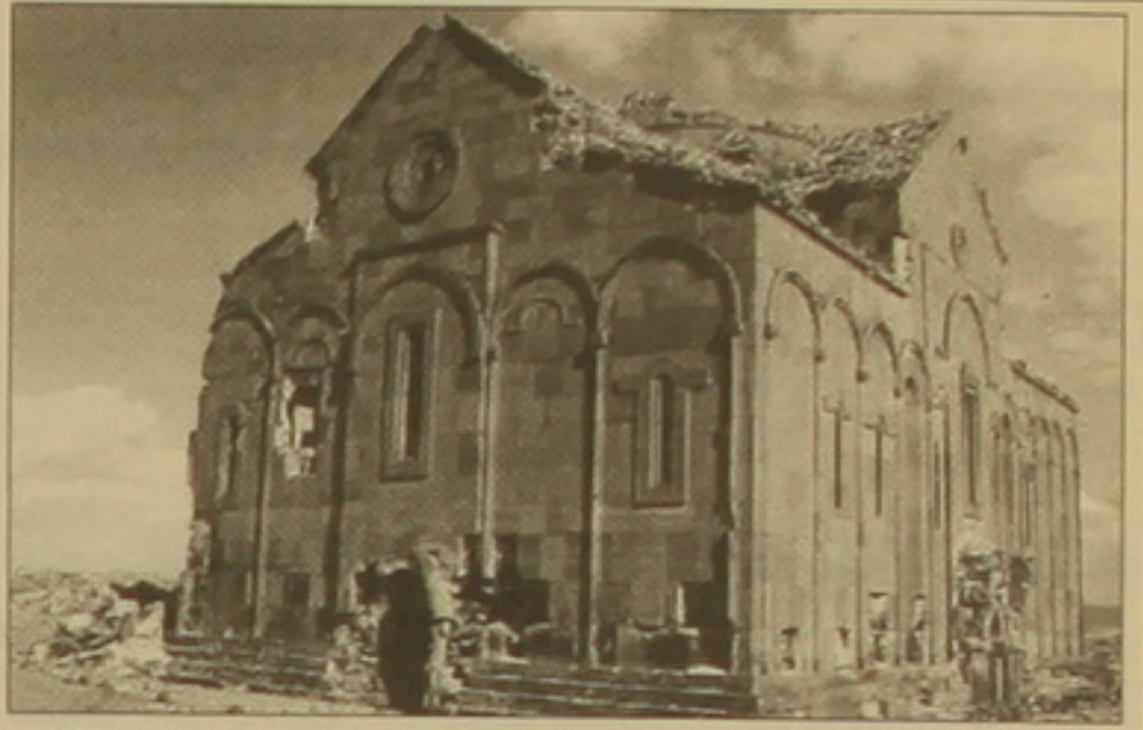
Անիսուր հասնում մասնագիտացված ժամանակակից զբոսաշրջության գործակալությունը սույն թվականի հուլիս-հոկտեմբեր ամիսներին կազմակերպում է 7 և 10 օրյա զբոսաշրջություններ դեպի ժամանակակից Հայաստան: Զբոսաշրջության ընթացում Դոմ կլինի Կարս-Անի-Իգդիր-Բայազետ-Վան (Ադրբեյջան) - Բիթլիս-Մուս-Կոնու-Երզրում-Սարիղամիշ փոխադրվում: Օգտվելով Ձեզ ընձեռնված բացառիկ հնարավորությունից եւ մասնակիցը դարձել մեր այս հիշարժան ուխտագնացությանը: Մանրամասների համար զանգահարել 091 203-206 եւ 094 203-206 հեռախոսահամարներով: