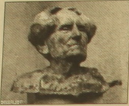
Ս. Սարյանի կիսանդրին: Զավեն Գ. Չուբարյան

Այսօրվա մեր սերն ու հիացմունքն առ Սարյանը ոչ թե անձի, այլ մեր ժողովրդի նկատմամբ է, որովհետև ազգը ծնունդ էր առնում միայն այն ժամանակ, երբ գտնում է, որ իր դասադասման և ոչնչացման ժամանակն էր գալիս: Երբ էր Անասու Ֆրանսը, երբ ասում էր. «Այն ժողովուրդը, որ ստեղծագործել էր զիստ, նրան մահ չի տալու»», արձանի բացման ժամանակ ասաց սարյանագետ, Սարյանի անձով ու ստեղծագործությամբ արդար ու հիացող,