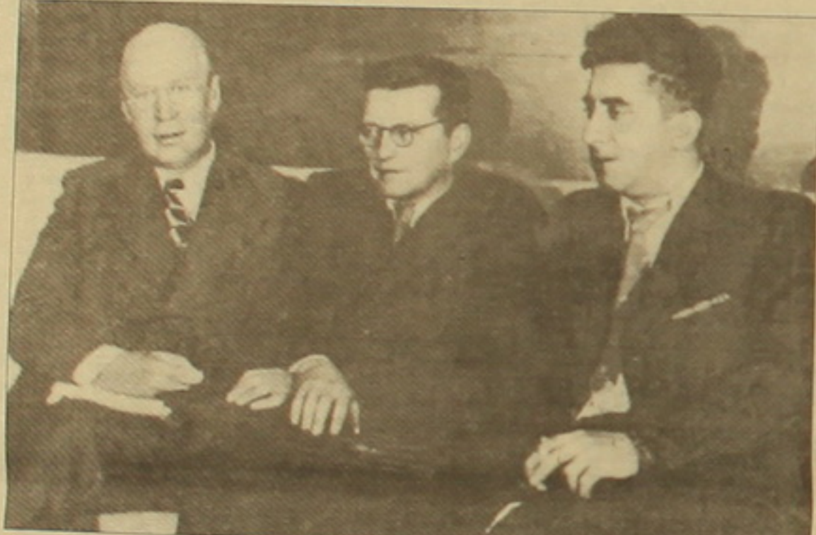
Արամ Խաչատրյանը Արագյան Գրիգորիի եւ Դմիտրի Շոտակովիչի հետ

- Ես Կեսարի նման եմ,- ասաց,- կարող եմ մի անհրաժեշտ գրավել միաժամա- նակ: Խոսակցությունը ինձ չի խանգարի: Ազատ խոսեմ: Ինչպես հասկացա,- շարու- նակեց խոսքը, ինչ-որ նշաններ անելով դարձիչների մեջ,- գրող եմ ու երաժիշտ: Մեկ-մեկ գրում եմ երաժշտության մասին էլ: երաժշտագետ: