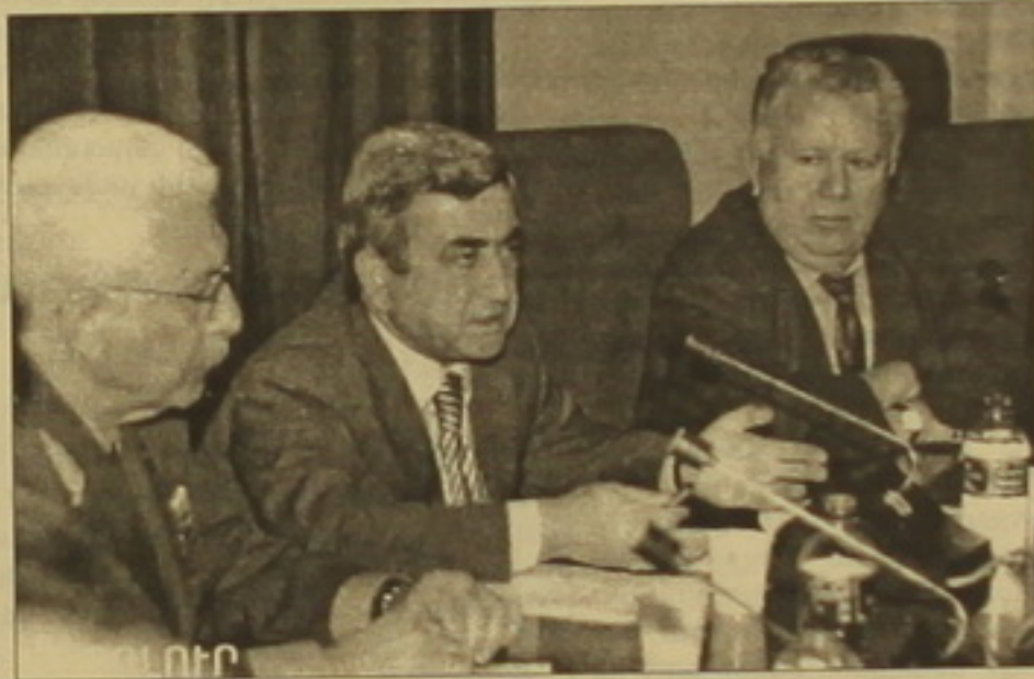
Տեսնելով 2007 եւ 2008 թթ. Հայաստանում եւ Ադրբեջանում տեղի ունենալիքը ընդհանուր նշանակության հավանականության բանակցային գործընթացի վրա բացասաբար ազդելու մասին, ԵԱԿ Միջազգային խմբի ղեկավարները համաձայնագրեցին 3-րդ Մերզյակովի ԻՏԱՆ-ՏԱՍՍ-ին հայտնելու, թե «... առանցքային հարաբերական դեմքերը, ովքեր հայկական կողմից վերջին 10 տարում մասնակցել են բանակցություններին, հաջորդ սարի սկսելու են դուրս մնալ բանակցային գործընթացից»: Հետաքրքիր է, որ Մերզյակովի ճեղքարկության իրավիճակի սարսփնակ կանխատեսումներ են անում, հասկանալի որ բանակցային գործընթացին մասնակցել են միայն Ռոբերտ Զոհարյանը եւ Վարդան Օսկանյանը: Միևնույն ժամանակ ստացվում է, որ Ադրբեջանական «առանցքային հարաբերական դեմքեր» մնալու են բանակցային գործընթացում:

ՄԱՐԻՆՍ ԽՈՍՏԱՅԵՄ Նոյեմբերի 27-ին Ազգային ժողովի ղեկավարները կնքեցին 33 ազգային անվտանգության ռազմավարության փաստաթուղթը, որն անցնելով համադաստիան գերատեսչությունների ներկայացուցիչներից եւ ղեկավարներից կազմված հանձնաժողովի 7 նիստերով եւ երեկ մի լրացուցիչ անգամ կնքվում էր ընդհանուր գիտությունների ազգային ակադեմիայում՝ ամբողջացել ու մեթոդաբանությամբ եւ բնութագրված համադաստիան է դարձել ուրիշ երկրների նմանափոխ փաստաթուղթերին: Սակայն տրամադրություն չստեղծվի, որ այդ փաստաթուղթը Ազգային ժողովում օրենքի տեսքով սահմանվի, ընդամենը ղեկավարները ընդունում են այն նրա դրույթները, որից հետո փաստաթուղթը գնալու է երկրի նախագահի մոտ՝ հավանության: Այդ եւ հաստատվելու է կառավարության այն նիստում, որը վերջին է նախագահը: Այս այս բոլորից հետո մեր անվտանգության ռազմավարության վերաբերյալ փաստաթուղթը ղարսադիր է դառնալու բոլոր գերատեսչությունների ղեկավարների եւ ղեկավարների համար, որոնք, որքան էլ զարմանալի է, ղեկավարության նախարար Սերժ Սարգսյանի վկայությամբ, նույն հարցի վերաբերյալ հաճախ սարքեր տեսակետներ էին արտահայտում: Փաստաթղթի ընդունումից հետո նրանք այլեւ նման բան անել չեն կարող: Իսկ Ս. Սարգսյանը արդեն իսկ գերատեսչությունների ղեկավարներին եւ ղեկավարներին ներկայացնելով փաստաթուղթը, տեղեկացրեց, թե այն վերջին համալսարանական կնքարկումից հետո բավական դրական փոփոխություններ է կրել՝ ընդհանուր առմամբ 615 իմաստային եւ խմբագրական առաջարկություններից ներառելով զգալի մասը: