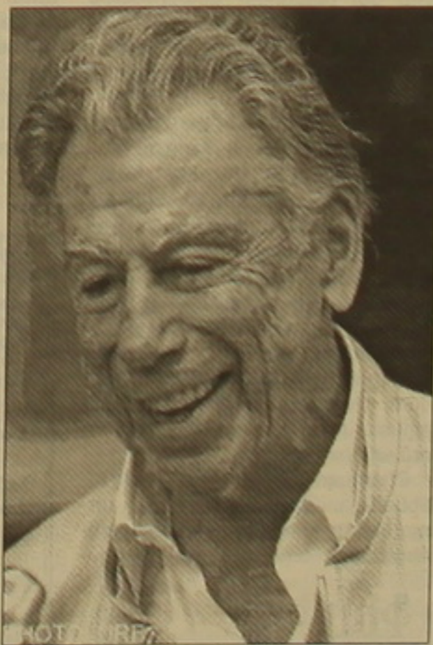
դեսության նախագահի եւ արտգործնախարարի հետ: Իրագել Երեւանում էին սիրող կարծիք այն է, որ եթե դրեւ Զրբուրյանը դժգոհ լինեւ «Լինսի» ծրագրով նախորդ տարիներին իրականացված վերափոխման ու վերակառուցման աշխատանքներից, ապա այս այցելությունը, թեկուզ խիստ անձնական բնույթի, չէր կատարվում: Վ. Ղ.

«Զրբ Զրբուրյանը իսկապես Երեւանում է եւ մի ֆանի օր դեռ մնալու է Հայաստանում», երեկ ընդամենը այսուհի սեղեկություն հաջողվեց հայտարարել ՀՀ նախագահի մամուլի ծառայությունից: Չարմանայի է, բայց մինչեւ մեր մեծահարուստ հայրենակցի ժամանումը այս մասին առավել բովանդակային սեղեկություն մեզ ստացել էինք աղեփ գոսի բնակիչներից: Սոցիալական արդեն սրատուրի սղատում են բնակարանաշինական նոր ներդրումների: Այդ սեղեկությունը եւս հավաստի կարելի է համարել, ինչպես նա ժամանման լուրը, որին սկզբում թերահավատությամբ վերաբերվեցին: Երեկ լուրը հաստատվեց նաեւ արտգործնախարար Վարդան Օսկանյանի կողմից, որ Հայաստանի հեռուստատեսությամբ հայտարարեց, թե մեծ բարեբարի այցը եղել է չնայած նրանք եւս կրում է անձնական բնույթ: Նա Երեւան է ժամանել Կաննից, որտեղ հետեւել է 58-րդ փառասոցին: Երեկ ցերեկը բարերարը Երեւանում է մայրաքաղաքի կենտրոնական մասում եւ, ըստ Վ. Օսկանյանի, լավ սղափություն է ստացել փոփոխություններից: Օրվա ընթացքում Զրբուրյանը հասցրել է հանդիպում ունենալ հանրա-