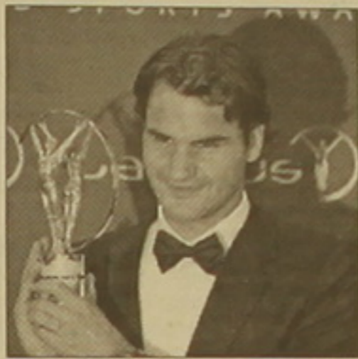
Ողջեր Ֆեդեռերը մրցանակով:

Պորտուգալական եռտրիկ ֆուդբոլի խաղասանը տեղի ունեցավ համաշխարհային մարզական ակադեմիայի սահմանած մրցանակների հանձնման հանդիսավոր արարողությունը: Այդ մրցանակաբաշխությունն անցկացվում է 1999 թ.: Ժյուրիի կազմում են համաշխարհային սպորտի նախկին «աստղեր» Մայլ Ջոդանը, Ջոն Մաֆինոյը, Էմերսոն Ֆիշթոլայդին և Սերգեյ Բուպկան: Այս արարողության անվանակարգում մրցանակներ են հանձնվում առավել աչի ընկած մարզիկ-մարզուհիներին: Լավագույնները որոշվում են աշխարհի 73 երկրների 700 լրագրողների հարցման արդյունքում: Ավանդույթի համաձայն, դարձաբան արարողությունը տեղի է ունենում եռտրիկում: