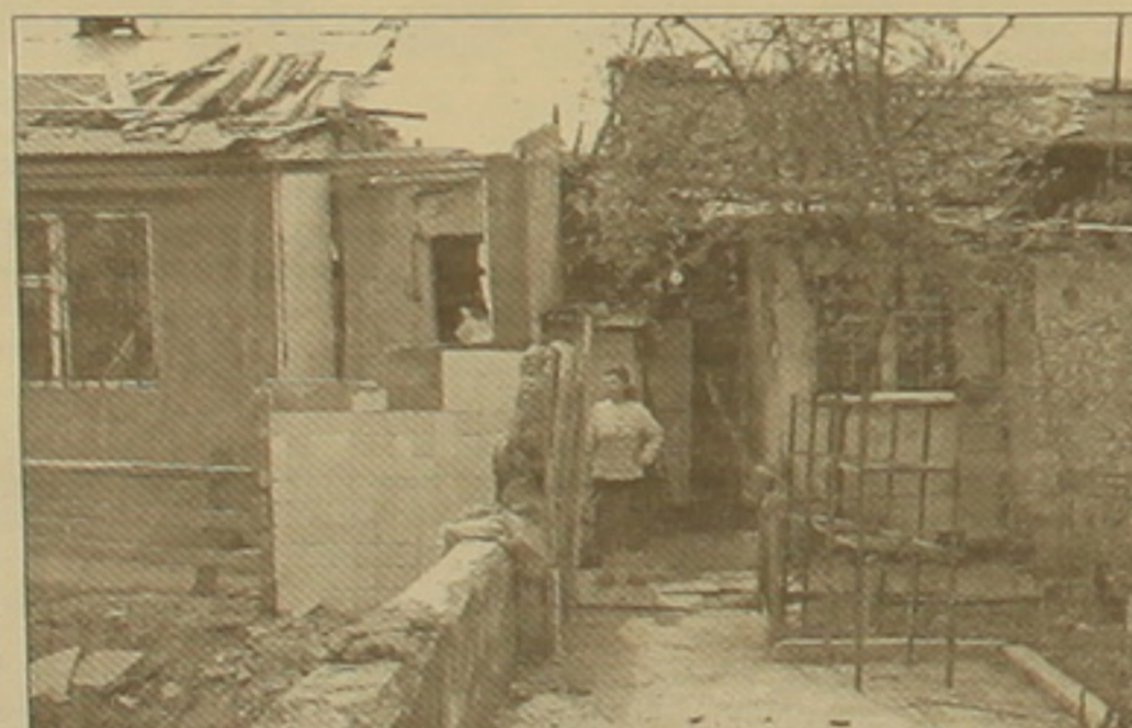
Փոսի կողքին ապրող Աննա Ղախանջյանը:

Սեդրակ Բաղդասարյանի 13-ամյա որդին ջուր կրելու ճանապարհին աղբի 13-ին ընկել էր փոսը եւ ոտքը կոտրել: Հայրը դիմել է դատախազության, ֆաղափարեցին, 33 վարչապետին, բոլոր այսաններին, սակայն անօգուտ: Աղբի 28-ին բնակիչները դիմել են առողջապահության նախարարությանը, ֆաղափարեցին, երկրի նախագահին, դարձյալ ոչ մի արձա-