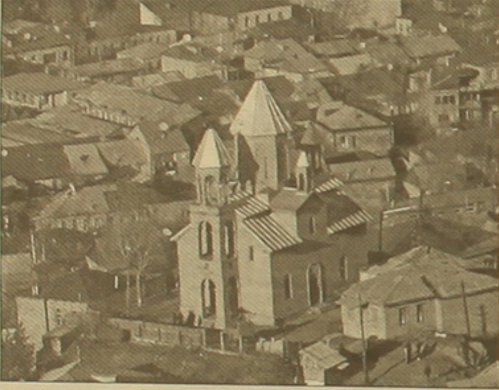
Ախալցխայի Սբ. Նսան հայկական եկեղեցին վրացիները յուրացնում են:

«Սա վիճելի հարց է: Գայերն ասում են, որ սա հայկական եկեղեցի է, վրացիներն ասում են՝ վրացական եկեղեցի է: Այդ լուսնառով մեք առաջարկել ենք ամբողջական ձեռավորել համասեղ համայնությունը, որն այդ հարցերը կնմանակի հանգիստ մթնոլորտում», ասել է համայն վրաց լուսնառով: