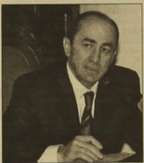
սկզբից մենք առաջարկել ենք հաստատել դիվանագիտական հարա-

«Երկկողմ հարաբերությունների զարգացման պայմաններում կրում են կառավարությունները, եւ մենք իրավասու չենք դա լիազորել պայմաններին»