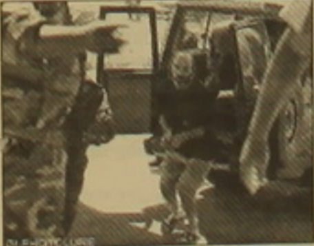
«Մեկ լողափ» բանսում թայմանական 70 բանասերկյալներին սպանում է սովամահություն, իբր նրանք չափազանց սկարացել ու

Ինչպես երեկ տեղեկացանք լրագրական գործակալություններից, բջջային կադի երկու օպերատորները «Արմենսել» և «Ղ-Տելեկոմ» թայմանավորվածություն են եկել վիճելի բոլոր հարցերի շուրջը և թայմանագիրը կատարողի առաջիկա ԵԱԿ ընթացում: Այս տեղեկությունը ստացվել է «Արմենսելից»: «Ղ-Տելեկոմին» մոտ կանգնած արդյունքները, սակայն, երեկ հրաժարվեցին որևէ կերպ անդրադարձնել այս տեղեկությանը, ասելով, որ Բանի դեռ թայմանագիրը ստորագրված չէ, ընկերությունը չի ցանկանում մեկնաբանություններ ատել: Ա. Մ.