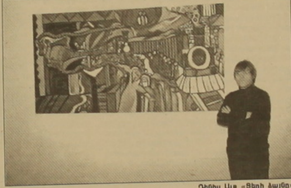
Դեմիս Ալթը «Ցեղի ձայնը»

սորիները, արարները և մանավանդ Համբենի, Մուսի, Սասունի, Վարդոյի, Չախոյի և այլ Երազանների «ֆրակացի» ու «խալապացի» հայերը: Վերջիններս հոծ դասակարգությամբ մասնակցեցին անցյալ սեղաններին Եվրոստրոֆարանի առաջ կազմակերպված եվրոպայի անախարհի ցույցին: Աղա ոգեցնելով Թուրքիայի վրա Երազանավոր միջազգային ճնշումներից Հայոց ցեղասպանության ճանաչման համար՝ մեր կրոնափոխ հայրենակիցներն արդեն իսկ հարցազրույցներով հանդես են գալիս ֆրանսիական ու ֆրանսահայ, գերմանական, քելզիական, թուրքական և հայրենի մամուլի էջերում: