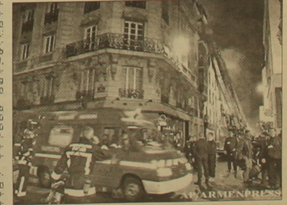
հաններից: Ետևած սվայների համաձայն, հրդեհը բռնկվել է 6 հարկանի շենքի առաջին հարկի նախաձարանում և սարածվել մյուս հարկերում: Հրդեհի թայմին շենքում 76 մարդ է եղել: Գ. Բ.

Լույս ուրբաթ գիշերը Փարիզի 9-րդ շրջանում գտնվող «Պարի-օմերա» հյուրանոցում բռնկված հրդեհը խոռոչ վնասներ է դատարարել: Ֆրանսուրեցը հաղորդում է, որ հյուրանոցի շենքը հիմնովին ավերված է: Չոհվել են առնվազն 20 անձին, այդ թվում 5 երեխաներ: Հիվանդանոց սարկված մարդկանց թիվը վեց ասույսյակ է: Նրանցից 13-ի վիճակը ծանր է: