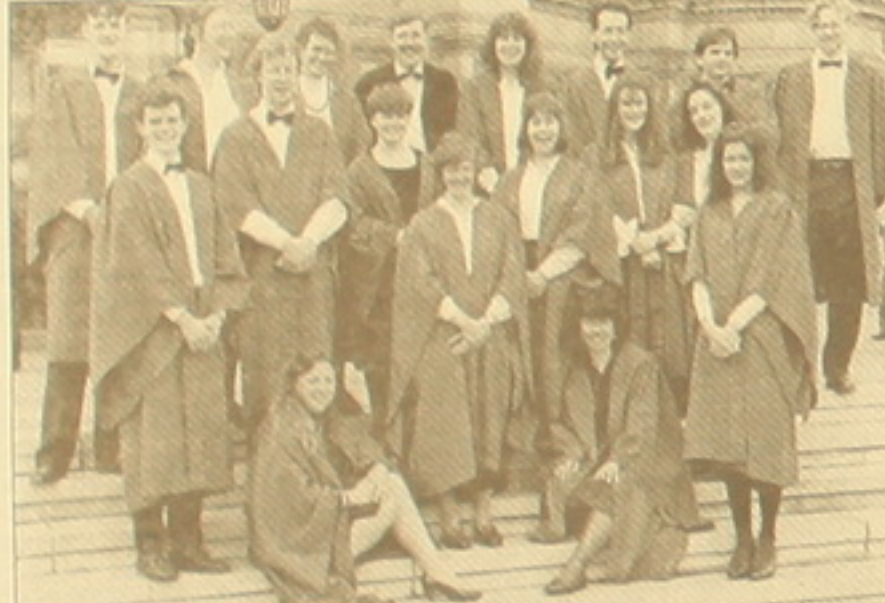
«Ռեճեսանտի երգչներ» երգչախումբը:

ժողովրդական երգչախումբը համալսարանական դարձավ հայ ունկնդիրների համար: Չունենալով մասնագիտական երաժշտական կրթություն՝ խմբերգային յուրերեսին հին վարդապետների երաժշտության նուրբ ընկալում եւ ոճային ըմբռնում: Տ. Լ. դե Վիկտորիայի «Ռոկոկո Բոնո» սկզբնական հանդիմանիկ օրհներգից մինչեւ Ջ. Մանիլանի «Divo Aloysio Sacrum» եղանակիչ հոմերո մոտեց կատարման ուղեկցում էր բացառիկ հոգեւոր մթնոլորտ: Իսկ Ու. Բրոուի «Agnus Dei»-ն համադասախանում էր այն ժամանակակից, որն արդեն ամբողջ փոխանակված աշխարհի Հոմերո Գոլիան-Նես-Պոլոս Բ դարի մահվան կառուցվածքով: