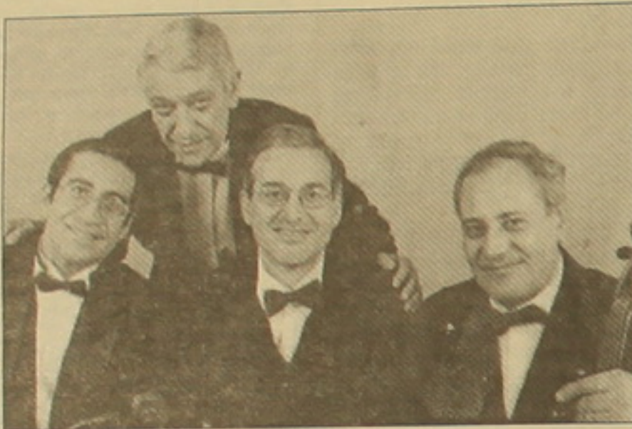
Կոմիտասի անվան քառյակը

Հայաստանի ղեկավար- մունիկ Գևորգյանի, Ազգային ղեկ- ավարի Գևորգյանի և Գևորգյանի ու կր- թության նախարարության կազմա- կերպում «Ազգային ղեկավարասահ» երաժեշտական փառասունի երկրորդ համերգը նվիրված էր Մեծ եղեռնի զոհների հիշատակին: