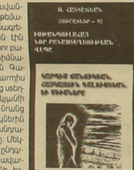
Ռ. Հասսեճյանի «Հուլիան-52»-ը

բեական կյանքը՝ ավանդական ձեռքերից ու թեմաներից խզում արձանագրելով: Այդ արձանագրումն էին հարուստ ժողովրդային նոր բանաստեղծության հիմնադիրներ Հայկազուն Գալուստյանը և Կարոյի ճանճիկները, որոնց ստեղծագործական կյանքի մանրամասներին, նրանց գրական օրհանակներին ու միջավայրին է անդրադառնում հեղինակը: Մեկնատարություններն ընդգրկում են նաև Ա. Շավարձի, Խաչիկ Ամիրջանի, Երվանդ Կողբյանի, Ջանգուլի, Ավետիս Ալիխանյանի, Էդուարդ Արամյանի ստեղծագործությունները: Իրենց ճակատկողման հայացման համար այս գրողները թուրքալուստ են քարկվում էին հալածանքների, և նրանց գրականությունը լայն առաջնություն էր չէր, արթններ հետո ունեւ սեղաբնակվեցին այլ երկրներում: Երվանդ Կողբյանը՝ Բեյրութ, Ջանգուլի՝ Փարիզ, Գեղամ Սեւանը՝ Բեյրութ, արդա Հայաստան: Գիրքը եզրավակվում է 40-ականների ժողովրդային իրապարհականության կենսագրության և հրատարակությունների մասին հակիրճ տեղեկություններով: