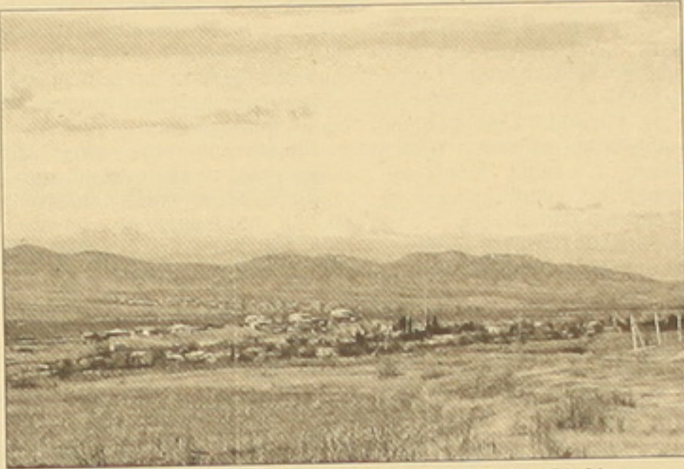
Դեբեդավան գյուղում բնակվում են ուղիների 3 ընտանիքներ:

Առայժմ արձանագրվել են միայն ֆուրի, ամոնիակի արտադրման միջավայր դուրս գալու ղեխեր, որոնք բարեխախտաբար, սեղական նշանակություն են ունեցել եւ չեն վնասել բնակչությանը: Այս դեպքում մթնոլորտ թունավոր նյութեր իրադես արձանագրող ձեռնարկությունը մտնում է Ավալերու լեռնանշատուրգիական կոմբինատը, հանրախայս «Մանես-Վալեբը»: 15 սարի առաջ խնդրի լուծումն իր վրա էր վերցրել խորհրդային կենտրոնացված կառավարությունը: Ձեռնարկությունում մաքրման որեւէ յեխնոլոգիա ընդհանրադես չի գործում, եւ այս սարածում մարդը ֆիզիկադես զգում է օդի մեջ թունավոր նյութերի գոյությունը: Առայժմ այս խիտ վտանգավոր իրողության դեմ «Պայաբը» սահմանավակվում է օրը 3 անգամ մթնոլորտում ծծմբի օփսիդների դարունակության ուսումնասիրություններով: Տեխնածին հնարավոր աղայուր են նաեւ ջրամբարները, որոնք երկարաժեշտով հարուս Չայասանում ուժեղ ցնցումների դեմում կարող են ցունամիի նման սրբել, սանել իրենց սարածի բնակավայրերը: Կ. Գ.