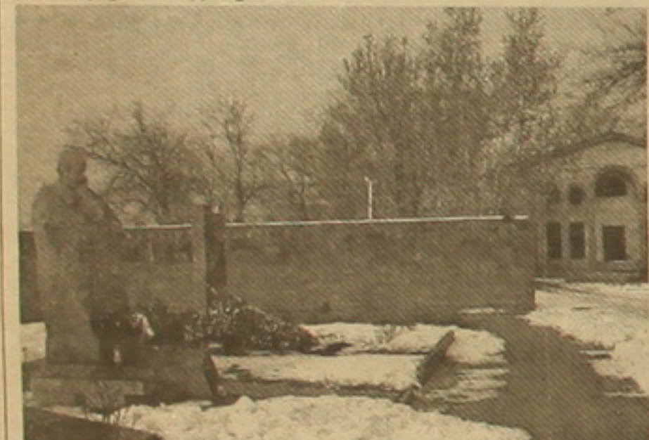
Այնպիսի մշակույթի պալատը:

Պանթեոնը ճանաչվում «Գուսան» ռեսուրսներն է՝ զիջելով ցուցի խրատ-ճանաչողական, ամառային ընդարձակ տնայնակ, որից ընդամենը մի քանի ֆայլ հեռու ննջում են հայ ազգի մեծերը՝ Կոմիասը, Ավետիս Իսահակյանը, Արամ Խաչատրյանը, Սերգեյ Փարազանովը եւ ուրիշներ: Երանց անունները սրբացրած մեր ժողովրդի համար այս վայրը սրբատեղի է լինում, մինչդեռ տարածքի կառուցումը անհրաժեշտ է: