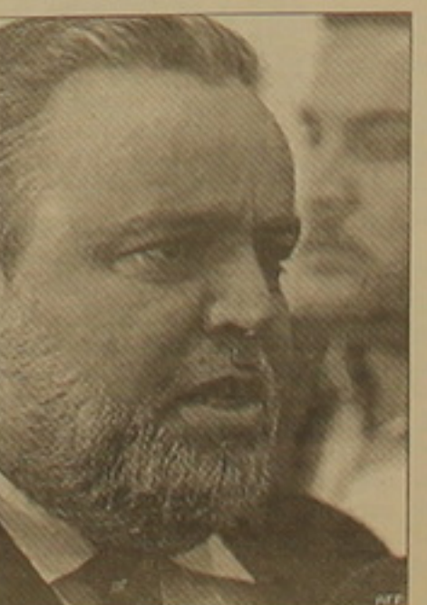
ժայի վիճակում են օկուպացիոն ուժերի ներկայության դայանադրում:

Սեկնաբանները կարծում են, որ խորհրդարանի նախագահի դատարանում սուննի արաբի ընտրվելը դաժնացնում կանդադարան երկրի փարախական կյանքի վրա, քանի որ սուննիներն Իրախի բնակչության երկրորդ խոսքը համայնքն են, մինչդեռ դրա ներկայացուցիչներից բացերը հալա-