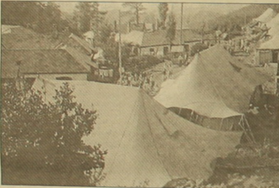
Մանուկյան արձակուրդի վրանաբաղաբը: