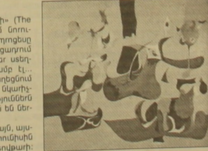
Գորկի. «Պարտեզ Սոչիում», 1941 թ.:

Գորկին երբեք չի եղել մեկ կամ մյուս հոսանքի հարող և իր արվեստը, առավել քան ուրիշներին, դասակարգում ենթակա չէ: Գորկու մահից հետո «Արև Նյու Յորկ» ուղղված մի նամակում Զուրնոնը նշանակում է արվեստի մի մեկնաբանի, որը կարծես չէր հասկացել Նյու Յորկի 36 Յունիոն Սիուերում գտնվող Գորկու արվեստանոցից դուրս եկած կավձների կարևորությունը. «Արչի Գորկու հիշատակի ցուցահանդեսի մասին գրված շատ կարճ հոդվածում նշված էր, որ նա նրա վրա ներգործություն են ունեցել: Դա դարձապես հիմնարկություն է: Երբ նա առաջին անգամ սրանից 15 տարի առաջ մոտի գործերի Արչիի արվեստանոցը, մթնոլորտն այնտեղ այնքան գեղեցիկ էր, որ նա մի րոպե գլխադրեց զգացի և երբ ուզեց ելա, այնքան խելով էի, որ անմիջապես հասկացա իմ նուրբ և անուրբ կամ իրենց գալիս, ապա ասեմ, որ նա գալիս են 36 Յունիոն Սիուերից: Անհավասար է, որ այնտեղ ուրիշներն են արդյունքը: Ուրախ եմ, որ համարյա անկարելի է դուրս դրնել նրա ազդեցությունից: Այնքան ժամանակ, որ նա կարողանա միսանի այդ ազդեցությունը, կարծում եմ, ճիշտ կգործեն: