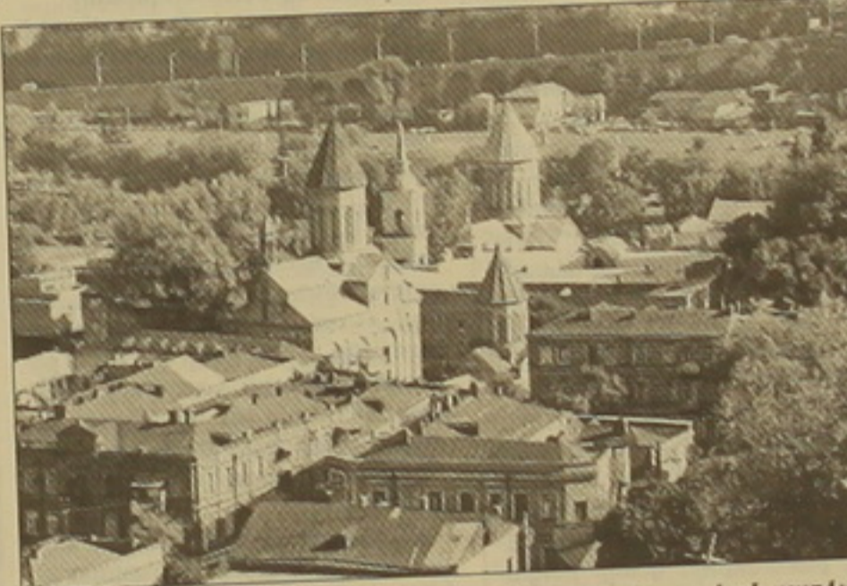
Չախից աջ՝ Նորաբենը, օուսական եկեղեցին, վրացական դարձած հունական եկեղեցին, հետին պլանում՝ Սիոնի Մայր տաճարը:

Մի ֆանի ճանաչակ հայ եւ վրացի երիտասարդներ հաշտեցման երթն սկսել են Նորաբենի հարե- անությունը գտնվող վրացական