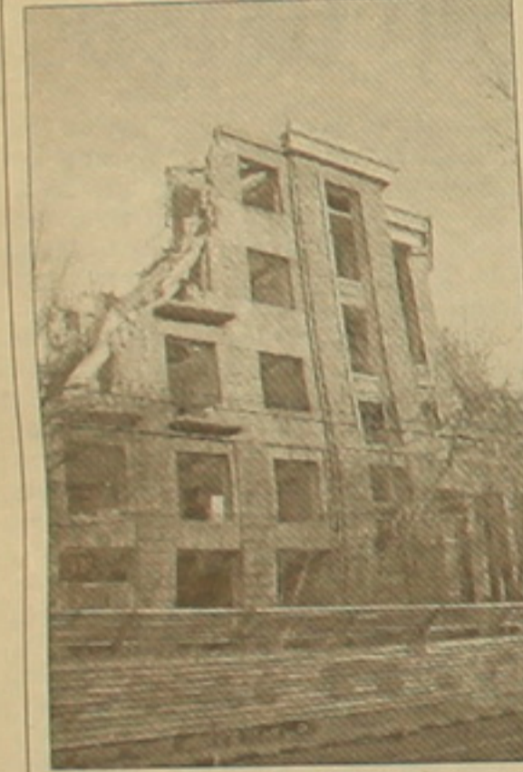
«Մեւան» հյուրանոցի մնացորդները

ֆաղափում», որի ժառանգական կենսոնը Երեւանում վերջնականապես կկորցնի իր դիմագիծը, կվերածվի անդեմ, Երեւանի համար խորք ունեւորների մի թաղամասի: Ես իմ խոսքում փորձեցի չօգտագործել բարոյականության կոչեր: Սակայն վերջում կուզեմայի, այնուամենայնիվ, անդրադառնալ մեր վարչապետի կողմից տեղին անտեղին հիշվող ու ցիվիլիզացիոն Նախկին մեծագույն հեղինակի մի ֆանի մեմորիա, դրանից ուղղելով մեր իսկ ժողովրդական ղեկավարությանը: Նախկին աշխատանքներից մեկում կա մի փոքր գրություն, վերագրված «Հայրենիքի եւ հայրենասիրության»: Այստեղ կարդում ենք. «Հայրենիք: [Դա նշանակում է] Երկրորդ սեր էր հարգանքի դեմք մեր նախահայրերի հիշատակը, ... իրար հաջորդող սերունդների հայրենի հողի վրա թափված ֆրիմոն ու արյունը ...», որի դրսևտումը, սվլալ ժառանգություն, ֆաղափամայր Երեւանի ժառանգականությանը, ֆաղափամայր Երեւանի ժառանգականությանը, ֆաղափամայր Երեւանի ժառանգականությանը, որի գլուխներից մեկը վերագրված է «Հայրենիք», ժառանգություն ասվում է: «Դրն է հայկական նկարագրի հիմնական գիծը: ... Ի՞ր