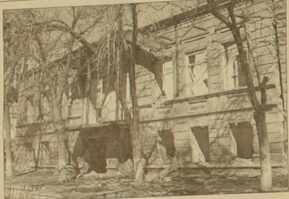
Ես մի շինություն Արամի փողոցում:

ժառանգությանն առնչվող օրենսդրական փոփոխությունների ժամանակ: Բայց միթե՞ ժողովրդի առաջին դեմքերն էլ են այդպես մտածում: Ի՞նչ է, մերում հիմա՞ր են, անխել են, չեն եղել աշխարհի այլ երկրներում, չեն տեսել նրանց մայրաքաղաքները: Ոչ, իհարկե ոչ: Մեր ղեկավարները ոչ անխել են, ոչ ի-