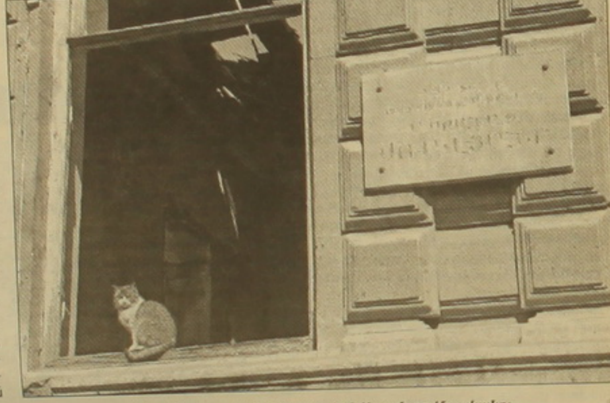
Արամի փողոց. Այստեղ ապրել է Ասքանազ Մոսվյանը:

չակել: Այս ձեռնարկում կարելի էր հավասարեցնել երկրի ղեկավարումն իրականացվող հեղափոխական ուժի գործելակերպով, մինչդեռ արդեն ֆանի սարի է՝ մեր սնտեսությունն առաջ է գնում բարեփոխումների ուղիով, այսինքն՝ այդ զաղափարական հիմնավորումը սնանկ է, այն ժառանգություն էր մեզնից: Երեւանի կենտրոնի ավերումը: Թույլատրվում մեմք այսօր ունեմք այն, ինչ ունեմք ու «այստեղ էլ ապրում ենք մեր սիրած