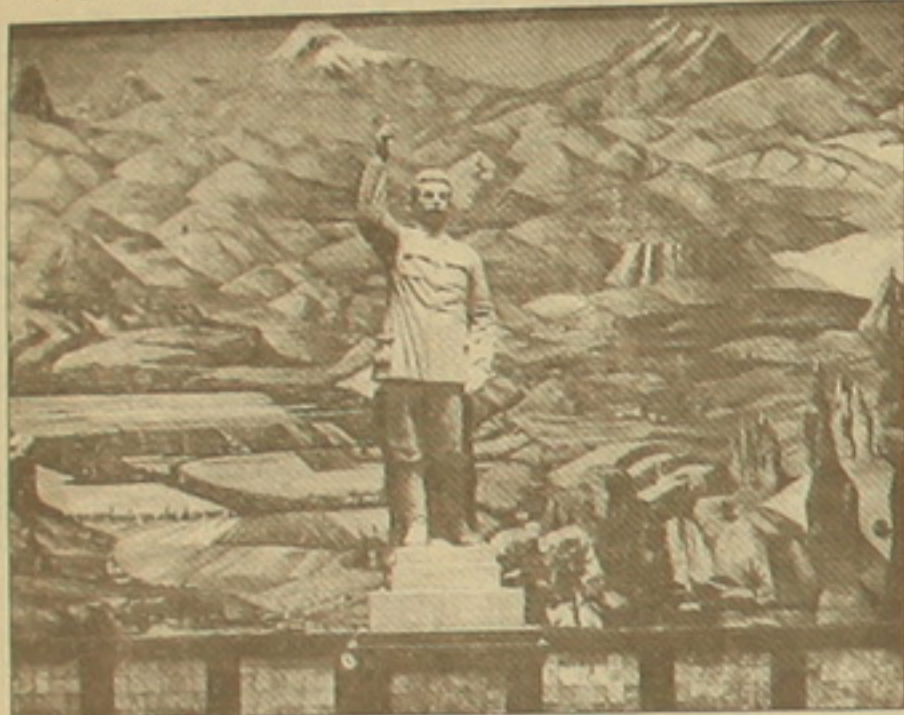
«Ֆայաստան» պաննոյի լուսանկարը՝ Ստալինի արձանով:

Սակայն լուսանկարի առջեւ՝ Սալիսի արձանը խանգարում էր սեսնել բնանկարն ամբողջության