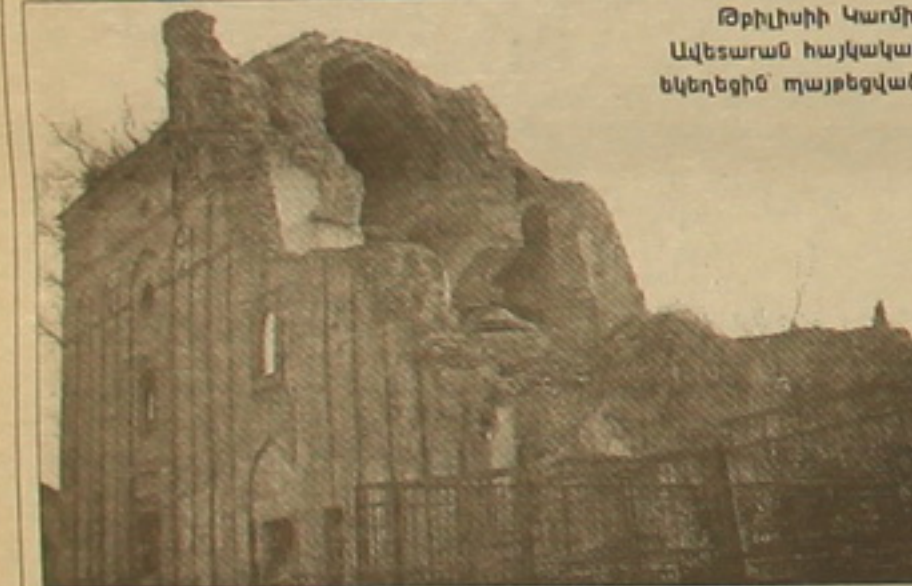
Թբիլիսիի Կարմիր Ավետարան հայկական եկեղեցին տայթեցված:

խոսություն» թեմայով: Իր տղամարդ- ությունը մերձավոր Արեւելի հայկա- կան գաղութներից նա ներկայացրեց ոչ այնքան լավատեսորեն: «Մեծութե- նեն ավելի ջերմությամբ այլի գարնող սիրահայ գաղութը աս փոխված նկատեցի այս անգամ, նուրացած էր կարծես, մնացած են հայերու այն մասը, որ ազգայնական զգացմուն- ներն մեկնելով չեն ուզեր ԱՄՆ կան