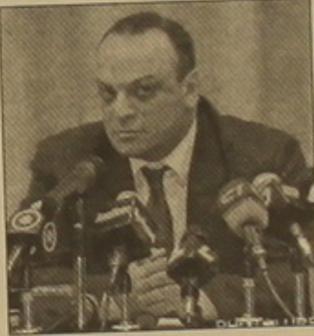
ԼՂՀ արտգործնախարարը մկասեց, որ Հայաստանի եւ Ադրբեջանի արտգործնախարարները գլխավորապես սեղեկական բնույթի հարցեր են ընտանում:

Արման Մելիքյանը, որը ԼՂՀ արտգործնախարար Նուրիյանի հետ առաջին ասուլիսն էր ասիս Երեւանում, մի քանի անգամ կրկնեց, որ «դարաբաղյան խնդրի կարգավորման բանալին Ադրբեջանի եւ Լեռնային Ղարաբաղի ուղիղ երկխոսությունն է»: Մասնավորապես, ըստ արտգործնախարարի, միայն Ղարաբաղը կարող է դաժնադարձություն վերցնել այնպիսի հարցերում, որոնք վերաբերում են փախստականներին եւ դարաբաղյան ուժերի վերահսկողության ճակ գտնվող սարաձայններին: Մարտի 2-ին Պրահայում նախատեսված է Հայաստանի եւ Ադրբեջանի արտգործնախարարների հերթական հանդիպումը: Որտեղ էլ դարաբաղյան կողմը սեղեկացված Վարդան Օսկանյան-Էլմար Մամեդյարով խորհրդակցություններին, եւ ինչ վերաբերում ունի Ստեփանակերտը որտեղ գործընթացի մկասմամբ: Մելիքյանի ասելով՝ դարաբաղյան կողմը բավարար չափով սեղեկացված է, «ինչը թույլ է ասիս մեզ որոշումներ ընդունել»: