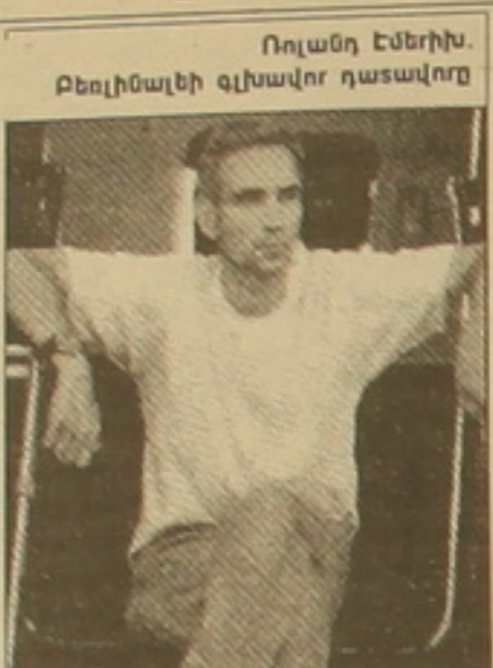
Ռուսոյ էմիլի, Բեռլինյան գլխավոր դասավոր

Ըստ փառասոճի սնտեն Դիթեր Կոսիկի, Բեռլինյան շաբաթը կներկայացնի 16 օրվա ընթացքում: Կինոֆորումի ընդհանուր ծրագիրը նա համառոտակի ներկայացրել է «սեխ, ֆուսբոլ, ֆուդբոլային» երրորդությամբ: Գրեթե խում են Եվրոպայի կինոմասնագ