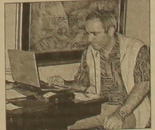
Վում է անցկացնել Թուրքիայում արդիլի 25-ից: Այս մասին եղյակ է լուծում Կաստարովը՝ լուծում էր Կասիմյանովը մրցանակային հիմնադրամը, սակայն իմրե հրաժարվել է: Փետրվարի

Հայաստանի աշխարհի բացարձակ չեմպիոնի կոչման համար Կաստարովը-Կասիմյանովը կիսաբեռավակից մրցախաղի անցկացումն առայժմ հարցալուծող է: Երբ է, մրցախաղի կազմակերպմամբ անհագր-գույլից Կասիմյանի ֆեդերացիան կես մլն դոլարով ավելացրել է մրցանակային հիմնադրամը այն հասցնելով 1 մլն 650 հազար դոլարի, սակայն Գարի Կաստարովը նախկինից ֆինանսական երաշխավոր է լուծում: ՖԻԴԵ-ից ու կազմակերպիչներից, ինչպես նաեւ առաջարկում է իրեն որոշակի կանխավճար վճարել: Այս մասին հայաստանի Կասիմյանովը լրագրողների հետ հանդիպման ժամանակ: Նա եղել է, որ մրցախաղը նախատեսվում է անցկացնել Թուրքիայում արդիլի 25-ից: Այս մասին եղյակ է լուծում Կաստարովը՝ լուծում էր Կասիմյանովը մրցանակային հիմնադրամը, սակայն իմրե հրաժարվել է: Փետրվարի