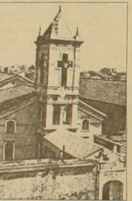
Տնօրենը: Նրա դասնությունը, մինչև 19-րդ դարը Պոլսում հայտնի են եղել Պա- լսյան գեղաստանի հայ ճարարա- րարները, որոնք համարվում են թուրքական ճարարարության

Հայոց գեղատաղանդային 90-րդ սարելիցի կառավարությանը այս սարի կիրառական թանգարանի սնորեն Առն Գրիգորյանի «Պոլսա- հայ ճարարարներ» աշխատու- թյունը: «Մինչև ուսումնասիրությունը սկսելը մեզ թվում էր, թե 1915 թ. Հա- յոց գեղատաղանդությունից հետո Ասամբուլում այլևս հայ ճարարա- րարներ չեն եղել: Ի զարմանս մեզ, դոկտորայինը բացահայտել են ար- քեր երկրներում ճարարարություն սովորել են կառուցել են բազմաթիվ ինժեներային կառույցներ: Ուսումնասի- րությունից դարձավ, որ ճար- արարներ բազմ Ասամբուլում գոր- ծածվել է երկրորդ համաշխարհային դաշտերից հետո, մինչև այդ ար- արված է եղել շինարար-վարչու- թյունը: Ուսումնասիրելով հայ ճարար- արների խմբի հետ, իսկ դրանից հետո՝ ուղեգրերով կրթություն ստա- ցած ճարարարներին: Ասամբու- լում ճարարարների և ֆաղափա- փառարի մասնագիտություններից բա-