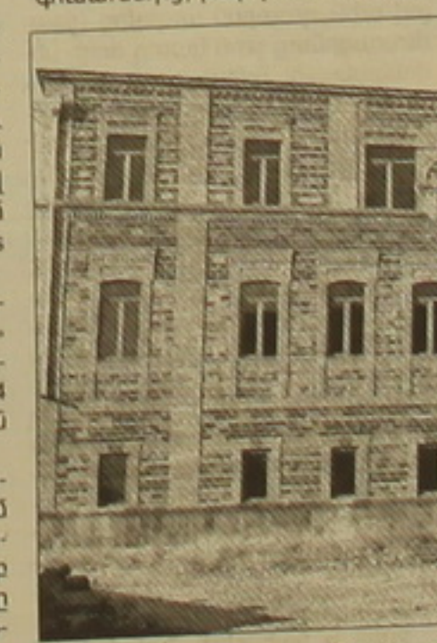
Չորսագյուղի 11 շենքը:

Գրիգոր Իզիթյանի՝ Չորս Նաջարյանի հանձնարարությամբ այլ անձանց տրված գումարների վերաբերյալ ձեռնարկված ստացվածների վրա առկա է գրառում այն մասին, որ գումարները տրվում են ֆոնդիային գումարներից, իսկ դրամ Գրիգոր Ի-