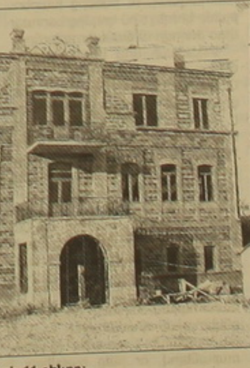
Չորսագյուղի 11 շենքը:

Գուրգեն Մելիքյանը Չորս և Զերոյան Նաջարյանների հետ ծանոթացել է 1989 թ.: Նրան կարճ ժամանակում դարձան մտերիմ բարե-