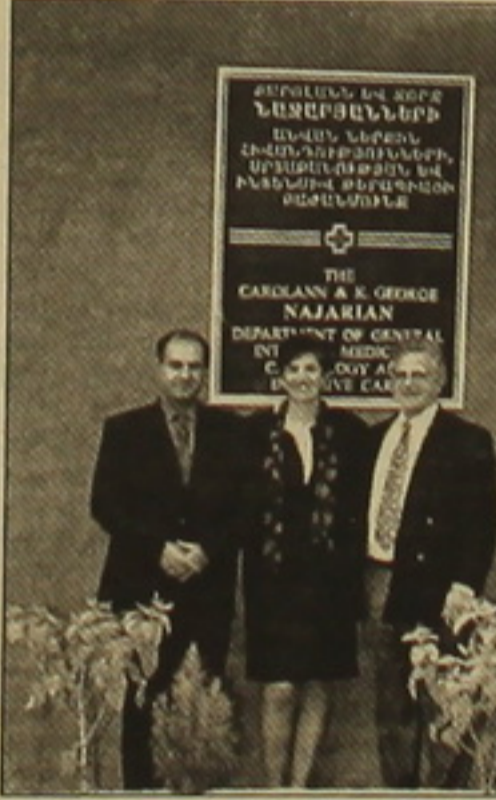
Մալաթիայի ինտենսիվ բուժօգնության կենտրոնի բացմանը:

Բարեփոխումը, որ հույս ունեին իրավադատ մարմինների օգնությամբ վերակազմվել արդարությունը, վերջին մեկ ամսվա ընթացքում ստիպված էին դիմել նաև լրատվամիջոցներին: Տասնյակ հարադարձվածներ եղան ինչպես հայաստանյան, այնպես էլ սփյուռքի լրատվամիջոցներում: Այնպես որ, այս գործը գլխավորվում է դարձել իրավաբանությունների համար: «Հեթ»-ը բազմաթիվ նամակներ է ստանում, որոնցում նամակագիրներն իրենց իրապատկություն են հայտնում մեր իրավաբան մարմիններից, դատական համակարգի և իրավաբանություններից: 2003թ. օգոստոսին ԱՄՆ ֆալսի-