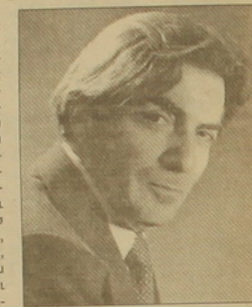
Չավեն Տաթևյանի հոգեհանգիստը կկայանա փետրվարի 12-ին, ժամը 18:00-ին (Երվանոյ Ջուլյարի 13, բն. 99), հուղարկավորությունը՝ փետրվարի 13-ին, ժամը 14:00-ին, Երևանի դասանի հանդիսատեսի թատրոնից (Մուսկովյան 3):

Հայ թատրոնը նոր կորուստ կրեց: Կյաֆի 79-րդ տարում վախճանվեց անվանի բեմադրիչ, մանկավարժ, ՀՀ ժողովրդական արտիստ, դրոշմաբեր Չավեն Տաթևյանի Տաթևյանը: Ծնուց 40 տարի նա նվիրումով ծառայել է դասանիների թատրոնին: Նորաձև էր բացելով նրա դասերի մեջ: Չավեն Տաթևյանի անվան հեռու կաղապար բազմաթիվ հեռախոսային ներկայացումներ, հյուրախաղեր ու փառատներ ոչ միայն ՀՀ-ում, այլև արտերկրում: Սիրված ու ճանաչված ռեժիսորի թեմայրած «Թեմայրած», «Երաժեշտային», «Ռոմանտիկներ», «Ջազմեններ», «Պատկերի համար», «Երկարագույն Պեղոյի», «Անագե մասանիներ» ելուստ ու լուսավորող ու հեռուստաբեմադրություններ հարստացրել են հայ թատրոնի խաղացանկը: Չավեն Տաթևյանի մեկնությունը անմարտ էր սկզբունքային նվիրյալի հիշատակը դեռ երկար տարիներ ուղեցույց կլինի նրան ճանաչողների համար: Այսօր նրա կորուստը սգում է հանրապետության արվեստի աշխարհը: