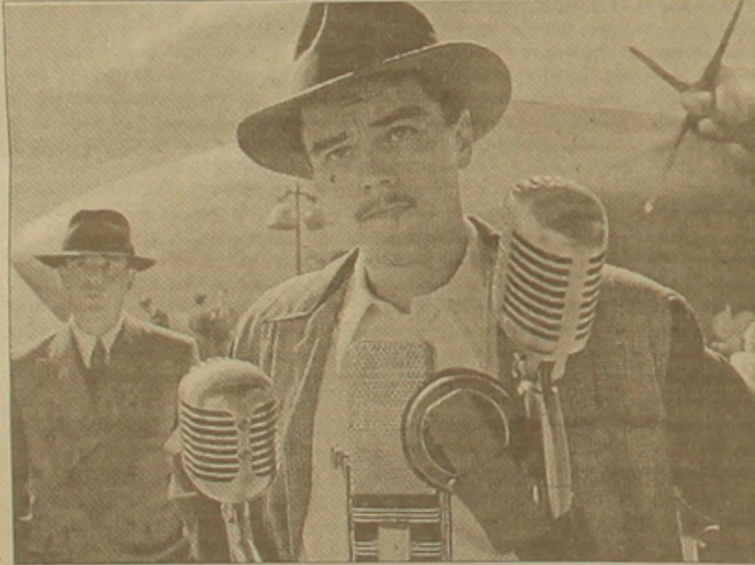
Լեոնարդո Դի Կապրիոն Լաուարդ Դյուրի դերում

Դյուրի դերը կատարում է Լեոնարդո Դի Կապրիոն: Ինչ վերաբերում է երկրորդական կերպարներին, ճակատագրի հեզանմանով, դրանք բաժին են ընկել միջոց գլխավոր դերեր խաղացած աստղերի: Նրանց վիճակվել է մարմնավորել 30-40-ական թվականների հոլիվուդյան «երկնաքանակներին», որոնց հանդեղ այնքան բարեհաճ էր Դյուրը: «Գիտ համադասախան հոշակավոր դերասանին» սկզբունքով անցած ընտրությունից հետո դերերը բաշխվել են հետեյալ կերպ. Էլիս Բլանկեթը Էթերին Դեփըրըն է, Էլիս Բեֆինսեյլը՝ Ավա Գարդները, «No Doubt» ռոֆ խմբի մեմբերակատարի Գվեն Սեֆանին՝ Ջի Դարլոուն, իսկ Ջոյ Լոն ստեղծել է Երկ Ֆլիքի կերպարը: Ֆիլմի գործողությունը ծավալվում է 20-40 թվականներին, ուստի մեծ Դի Կապրիոյին չեն տեսնի արդեն տարիներ առաջ, արտադրող անփույթ Դյուրի կերպարանով: