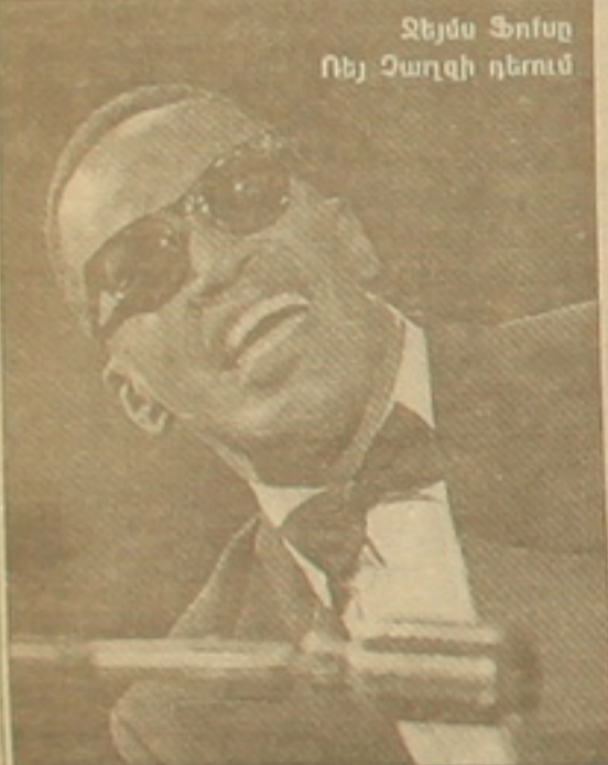
Ջեյմս Ֆոսը Ռեյ Զարդի դերում

Կինոնկարը դասնում է գրողի եւ նրա հարեւանությանը արդող չորս որ շղաների բարեկամության մասին: Դենց այդ բարեկամությունն էլ ոգեցնել է Բարրին իր հոշակավոր մանկական գրերը հորինելու: