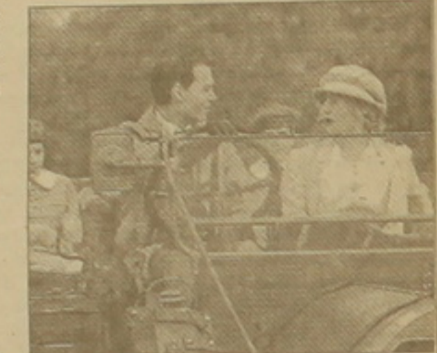
Ջոնի Դեփը եւ Էլիս Ռիմսուեթը «Կախարդական երկիրը» ֆիլմում

Իհարկե, ինչպես արդեն նշվեց, այս տարի կենսագրական ֆիլմերը չափից շատ են, բայց