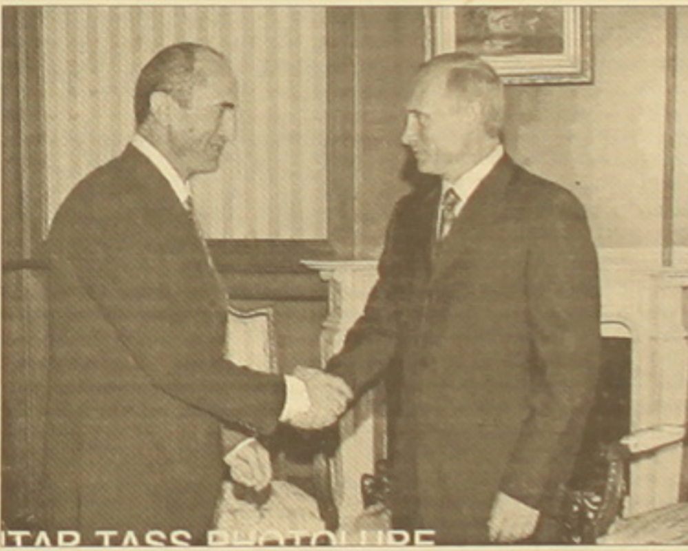
Պուսինի և Զոչարյանի հանդիպումը Սոչիում։ Պուսինը (ձախ) և Զոչարյանը (աջ)։

Ավանդվում էր, որ Սոչիում նախագահներ Զոչարյանի և Պուսինի հանդիպման առաջնային թեմաներից մեկը կդառնա 2006-ից Հայաստանին մատակարարվող գազի թանկացման խնդիրը։ Երեկ՝ մինչև ուժ երկրյան ռուսական լրատվամիջոցները որևէ տեղեկություն չէին տվել՝ թանկացումը է, եւ եթե այո, ապա՝ ինչպե՞ս։ Սակայն դասելով Ռուսաստանի նախագահի՝ Ուկրաինային վերաբերող հարցի մեկնաբանությունից, կարող ենք ենթադրել, որ գազը հաստատված էր։ «Կա ռուկա։ Պայմանները բոլորի համար մեծ է լինեն հավասար։ Մեր բոլոր գործընկերները մեծ է լինեն հավասար իրավիճակում», ընդգծել է Պուսինը։