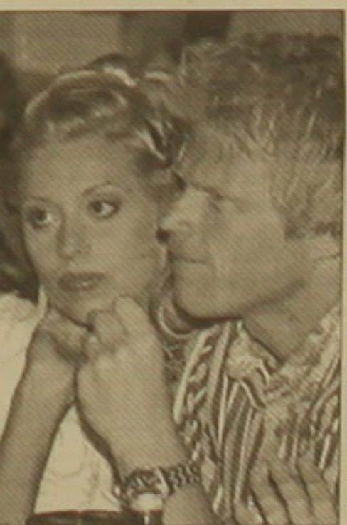
Մար ին ղայախաղից հետո, ղեկ է հավաքականի ղյխավոր մեներեք Օլիվեր Բիրոնը: Վերջինիս հետ համարմի են նաև հավաքականի ղյխավոր մար-

Գերմանիայի հավաքականի ֆուտբոլիստներն աշխարհի առաջնությանը կնախադասախաղեն Սարգիսիայում: Բունդեսլիգայի առաջնության ավարտից մի ֆանի օր անց հավաքականի կազմում հայտնաբերված ֆուտբոլիստները կմեկնեն Սարգիսիա, որտեղ մայիսի 16-21-ը փաստորեն մի փոքր կհանգստանան ֆուտբոլից: Ֆուտբոլիստները Սարգիսիա կմեկնեն իրենց կանանց և ընկերուհիների հետ: Օրինակ, հավաքականի ղայաբարում դարձախաղա Օլիվեր Կանը կհանգստանա իր ընկերուհու՝ Վերենա Վերսի հետ: «Ես խոսել եմ հավաքականի ֆուտբոլիստների հետ և նրանց երեք ֆուտբոլը հանաճայն են կանանց մասնակցությանը առաջին հավաքին: Ես էլ նրանց հետ համարմի են: Այդպես ֆուտբոլիստներն ավելի լավ կհանգստանան ծանր մրցաբարից հետո և ղայախաղ կլինեն մարզումներից: Ուստի մենք նախադաս յուրաքանչյուրի համար երեքտեղանց հա-