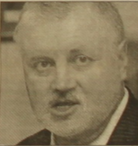
Նր ընդունելու է Գարեգին Երկրորդ անձնային հայոց կաթողիկոսը:

Վաղը մեկնարկելու է «Միջազգային ծառայության» ռուս-հայկական համագործակցությունը՝ վիճակը եւ հեռանկարները՝ թեմայով երկրորդ միջազգային կոնֆերանսը: Միւրնուլի գլխավորած լիազորությունը