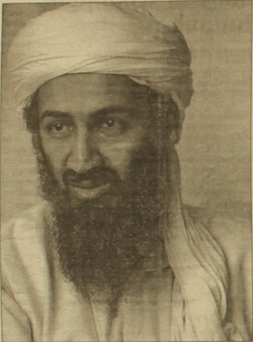
Խաղաղացի արարների կյանքում: Եզրագծեր, սառույցներ, ենթահողմեր, փոփոխություններ, սիրահողմեր և ղաղթսիսիցներ մեկնեցին Պակիստանի սահմանակից Փեշավար ֆառալը՝ նրա կողմից մարտնչելու ռուսների դեմ: Բայց երբ մոզահեղձներն էլ բեն Լադենի արարական լեզուներն հաջողվեց դուրս մղել ռուսներից Աֆղանստանից, աֆղաններն իրար դեմ դուրս եկան՝ տնտեսական մաղձի մղումներով:

Ցաղ միայն մեկ լրագրողի է հաջողվել մուտք գործել «Ալ Ղաիդայի» ղեկավարի սրբություն սրբոց համարվող հասուկ առանձնատանը: Դա քրիստոնեական «Ինդիպենդենթ» թերթի ավելի քան 30 տարի Միջին Արևելքում գործող սեփական թղթակից, բազում քրիստոնեական և միջազգային մրցանակների արժանացած, ճանաչված գրող և լրագրող Ռոբերտ Ֆիլմ է, որը համարակալություն է ունեցել գնալու աշխարհի ամենապաշտված մարդու՝ Ուսամա բեն Լադենի հետ: Նա իր հանդիպումները գրանել է Ամզիայում «4-րդ իշխանություն» հրատարակչության վեբըստ լույս ընծայած «The Great War for Civilisation: the Conquest of the Middle East» («Զաղափակրթության համար մղված մեծ պատերազմը. Միջին Արևելքի նվաճումը») գրքում, որտեղից «Ինդիպենդենթ» մագազինը տարբերակում էր հոկտեմբերի 1-ի համարից սկսած հասվածներ է մեկայայցում իր ընթերցողներին: Ստորև բարձրանալով տալիս ենք այդ առաջին հրատարակումը: