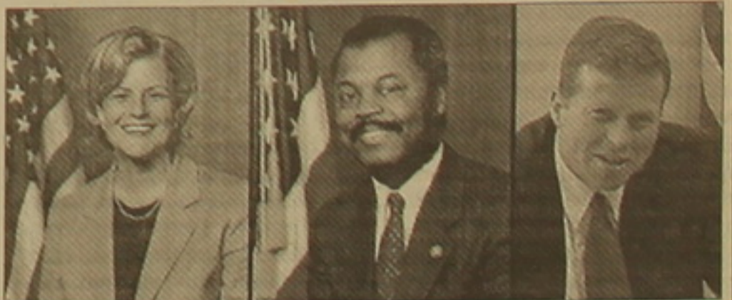
Իլեանա Ռոս-Լեիթին, Դոնալդ Փեյն, Զարի Դեմք

ՎԱՇԻՆԳՏՈՆ, 5 ԴԵԿՏԵՄԲԵՐ, ՆՈՒՅՆԱՆ ՏԱՊՈՒՆ: ԱՄՆ Կոնգրեսի հայկական հարցերով հանձնախմբի միջոցով են եւս երեք կոնգրեսականներ հանրապետականներ Իլեանա Ռոս-Լեիթին, Զարի Դեմքը եւ դեմոկրատ Դոնալդ Փեյնը: Դաշտագրվել է, որ Հայկական Ամերիկայի հայկական համագումարից, հանձնախմբի անդամների թիվը հասավ 152-ի: