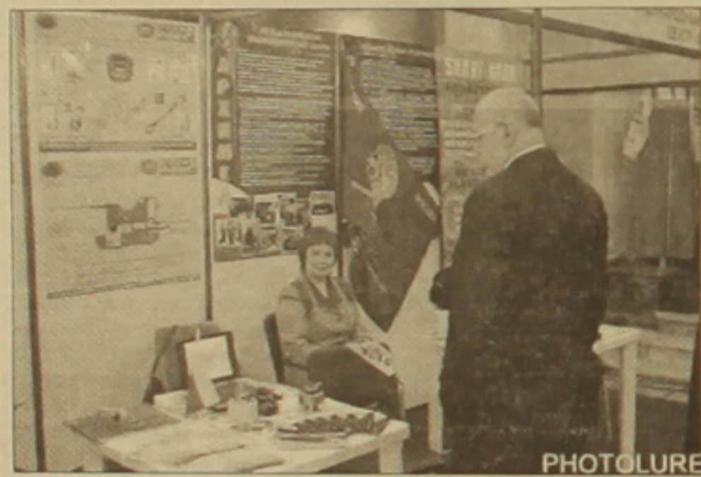
Երեկ իրենց մարզի «Ստար» գործարանից:

Մինչ ցուցահանդեսի բացումը մամուլի առկա էին հրավիրել ցուցահանդեսի կազմակերպիչներն ու երկու երկրների կառավարությունների եւ գործարարների ներկայացուցիչները: Ռուսաստանի սննդամթերքի կազմակերպիչներն ու առեւտրի նախարարության ղեկավարներն սնորեն Ալեքսեյ Կառլաբարի խոսքում անդրադարձ կատարվեց հայ-ռուսական սննդամթերքի հարաբերությունների ներկա վիճակին եւ այսօր տեղի ունենալի գործարար համաժողովի նպատակներին: Նշվեց, որ երկու երկրները նպատակ ունեն նպաստել հասկապետ ինովացիոն ոլորտի զարգացմանը: Նախարարության ներկայացուցիչը կարեւորեց տրանսպորտային խնդրի լուծումը, սակայն այդ կառավարությունը արխազական երկաթուղու վերագործարկման մասին ոչինչ չասվեց, այլ միայն հիշատակվեց Պրն Կավկազ-Փոթի լասանավալին անցման գործունեության կարեւորությունը: