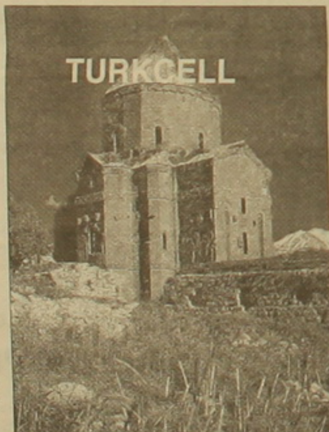
Հայկական եկեղեցին գովազդային վահանակ

Ես էլ ուզում են հավաստիանալ, որ մեծ հասարակությունում դեռ անեն ինչ ֆայլված չէ, որ այդ ճարդահոտ ու ոսկեգոծ վզերով սղամարդկանց կողմին ունեն երիտասարդներ, ովքեր ունակ են դաստիարակելու և ծառայակելու հայի մախոզները: