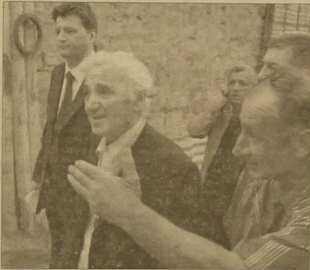
Երեկ հերթական հավակնոս ելույթն է ունեցել եւ հերթական անգամ վիրավորել Հայաստանին: (Տե՛ն կողղի սյունակը): Տե՛ն էջ 2

«Օգսվելով մայիս ամսվա վերջում Հայաստան կասարած իր այցելությունից, Ըառլ Ազնաւիւրը այցելեց նաե իր հոր՝ Սիւա Ազնաւիւրյանի տուն՝ Տավաղի, Վրասան: Այս երկում աղորղ հայերի վիձակը ցնցեց նրան»: Այս տղերը որղես ենթավերնագիր կցված են Փարիզում լույս տեսնող «Nouvelles d'Armenie» (Հայաստանի նորություններ) ամսագրի 2005 թ. նոյեմբերի համարում հրատարկված հարցազրույցին, որն աշխարհահռչակ երգի հետ վարել է ամսագրի խմբագիր Արա Թորանյանը: Ընդարձակ հարցազրույցի այս հատվածը թարգմանել եւ խմբագրությանն է տրամաղել Ալեկ Ենիգոնձյանը: Ինչղես կտեսնի ընթերցողը, մեծանուն երգիչը, որ Վրասանում նախագահ Սաակաձիլու հյուրն էր, բառեր չի խնայում Վրասանում եւ հասկաղես Տավաղիում սվալ վիձակը ներկաղցնելու: Դա բնցասական կարծի է մի երկրի մասին, որի խորհրդարանի նախագահը հենց