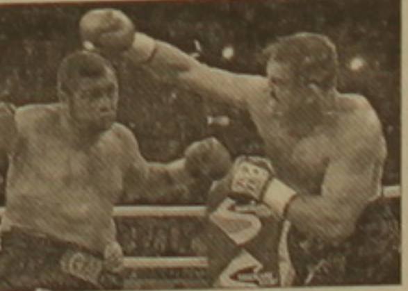
«Բուֆորի ցուլ» մականունն է կրում: Հիմնական դասձառաբանությունը Մասկանովի սարիքն էր: Ըստ ցուցում էին, որ ռուս բոցմամարտիկը չի դիմանա 12-նաունդանոց մենամարտի լավաճությանը: Սակայն կան-

Համբուրգում անցկացված ղորֆեսիսում բոցմամարտի մրցաբաժնի գլխավոր մենամարտը ռուսաստանցի գերանաբաժնի Օլեգ Մասկանովի մրցակիցն էր թուրք բոցմամարտիկ Սիման Սամիլ Սամիի հետ: Այդ մենամարտի հաղթողը իրավունք էր ստանում բոցմամարտի համապարհային խորհրդի (WBC) վարկածով աշխարհի չեմպիոնի տիտղոսը վիճարկել ամերիկացի Հասիմ Ռահմանի հետ: Վերջինս, ինչպես հայտնի է, Կիլիկոյի՝ ռիմոնի հրաժեշտ տալուց հետո կրում է աշխարհի չեմպիոնի տիտղոսը: