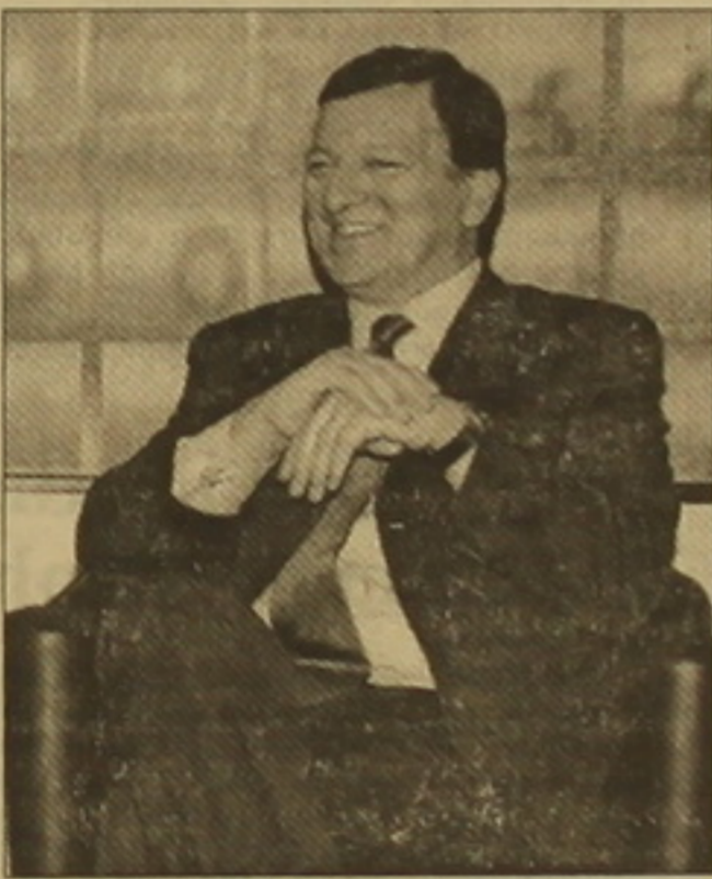
Իրաքի հետ Եվրոպայի հարաբերությունների շուրջ, Բառոզուն հաստատում է:

Այսօր է արտահայտվել Եվրոհանձնաժողովի նախագահ Ժոզե Մանուել Բառոզուն Հարվարդի համալսարանում (ԱՄՆ) վերջերս արտասանած ճառում, Բրյուսելից հաղորդում են Արդարության եւ Ժողովրդավարության եվրոպական ֆեդերացիայի գրասենյակից: «Մենք ղեկավարում ենք մի նոր շրջան, որ թուրքիան կարելի է արեւելքում եւ Եվրոպայի սոցիալական ու սենսական աղաքայի սեսակեթից մեծ ներուժ ունի, ասել է Բառոզուն: Այսուհանդերձ, ֆրդերի եւ ազգային փոփոխությունների խնդիրները մնում են շատ հարցեր թուրքիայում: Ազգային փոփոխությունները թուրքիայում շարունակաբար դիմազրվում են մարդու իրավունքների խախտումների»: