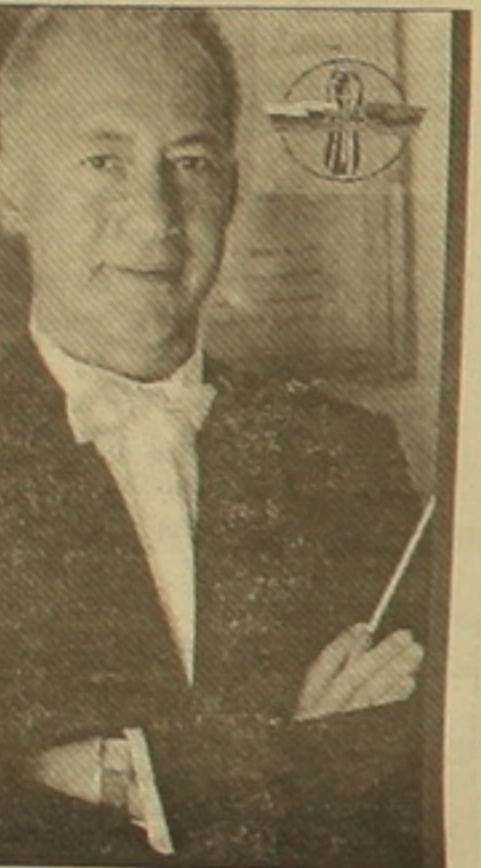
Ռախմանինովի վերջնականապէս համոզութեամբ վիրտուոզութեամբ նվագելով «Քիսային» ջութային իմպրովիզացիաներով:

Հայաստանը միշտ ստատու է Վերջինի Սոփիակոյի գալուստը, որը վերջին տարածակում աշխուժացրել է մեր երկրների մշակութային կապերը: Արդիականութեան կարկառուն երաժիշտ այստեղ հանդես է եկել որպէս ջութակահար, համույթի մասնակից եւ դիրիժոր՝ նախ եւ առաջ «Սոսկվայի վիրտուոզներ» նվագախմբի, իսկ 2001 թ.՝ Ռուսական ազգային նվագախմբի վահանակի մաս: Այս տարի գալով 2003 թ. ստեղծված սիմֆոնիկ կոլեկտիվի հետ, Սոփիակոյը հաստատեց գեղարվեստական ղեկավարի իր տղանը: Նոր նվագախումբն ունի բազմաթիվ արժանիներ, ակնհայտ է հայրենական արվեստի ավանդույթների հաջորդաւորութիւնը: Մասնավորապէս դաշտագետը է մոսկովյան սիմֆոնիկ նվագախմբի բնորոշ հնչողութեան լիարժեքութիւնը, որի հազնգնորդութիւնն արտահայտում են յղման գործիները, իսկ խորութիւնն ու արձագանգող հնչողութիւնը՝ հարվածայինները: ՌԱՖՏ-ում այդ երկու խմբերը համալրված են գերազանց երաժիշտներով, որոնց հնարավորութիւնները երեւանյան երկօրյա հյուրախաղերի ժամանակ ներդաւանակներն միավորվեցին ինչպէս փայտե գործիների խմբի, այնպէս էլ լարայինների կազմի հետ, որտեղ տղաները թաւերախումբի խմբի տեմբային միաձուլութիւնը: