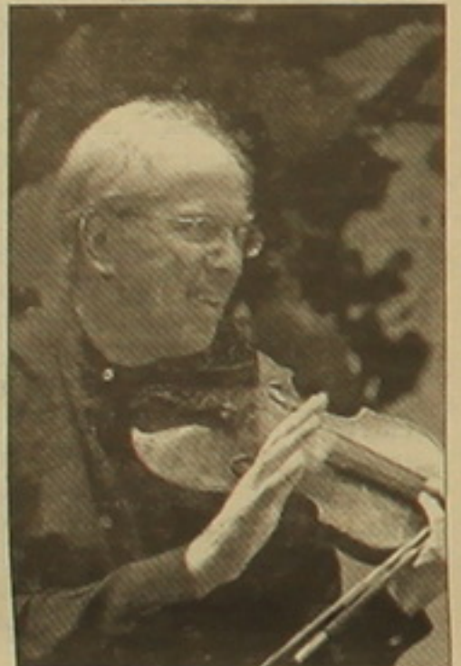
անկրկնելի է այդ ձայնը, այնքան զուգորդվում է Կրեմերն այն հաղորդելիս:

Գիդոն այն ժամանակ 30 տարեկան էր, 4 անգամ արժանացել էր միջազգային դափնեկրի կոչման, այդ թվում Ն. Պապանինիի և Պ. Ի. Չայկովսկու անվան մրցույթի առաջին մրցանակների: Դավիթ Օյստրախի արժանավոր սանը (1971 թ. նա ավարտել է Մոսկվայի կոնսերվատորիան Դ. Օյստրախի և Պ. Բոնդարենկոյի դասարանում, 1973 թ.՝ ջութակի մեծ վարժեսի մասնագետից մեկ տարի առաջ, աստիճանաբար) անմիջապես դարձավ ջութակի խորհրդային դպրոցի առաջատար: Արևելաբար օժտվածությունը նրան թույլ տվեց կուսակել ուսական դպրոցի լավագույն արժեքները: Դ. Օյստրախից՝ հնչյունի մոգականորեն արտահայտիչ կանխիկան, Լ. Կոպանից՝ մեկի ներգիտան, որը բացում է սրանցեղենության երևակայության հորիզոններ: Այդ հասկացությունների համադրությունն արդի աշխարհի նկատմամբ զուգորդվելով՝ Կրեմերի արվեստին հաղորդեցին բացառիկություն և ունիվերսալություն: