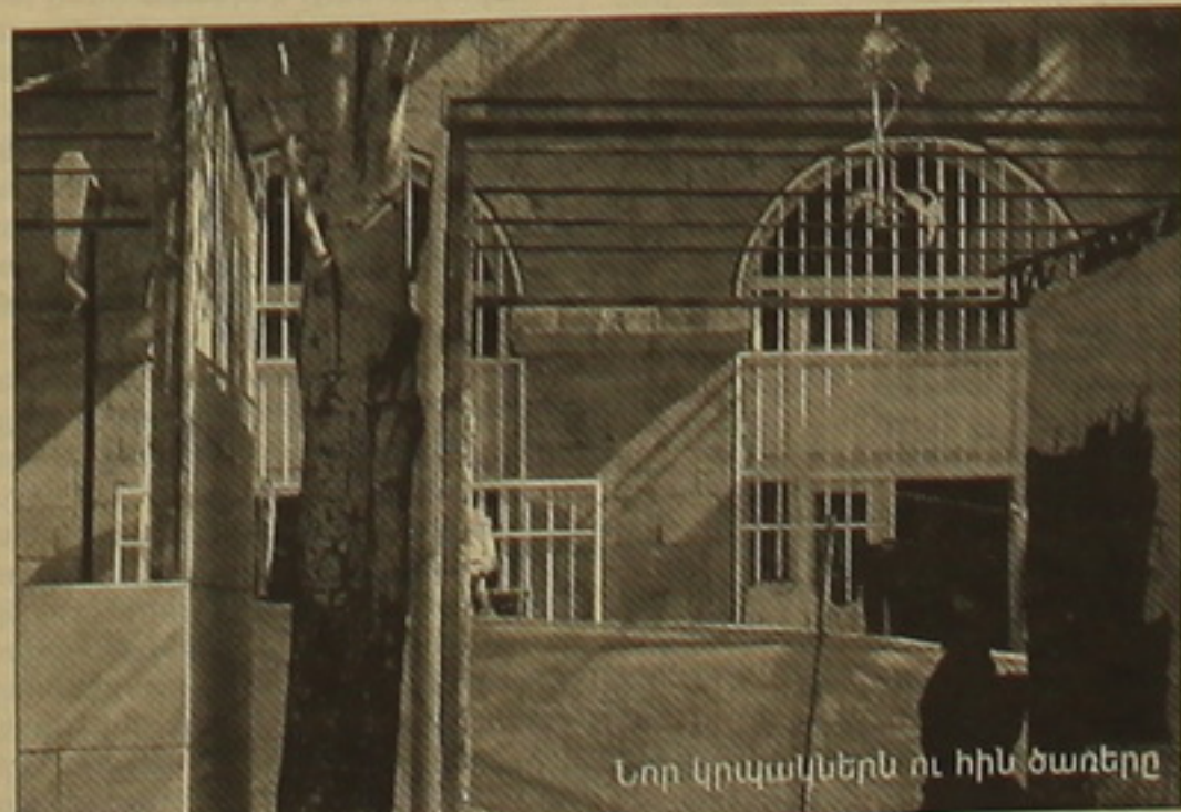
Նոր կրկաններն ու ինչ ծառերը

Երեւանում ծառեր կան, որ հողի վրա դեռ տեղ ունեն: Բայց այդպիսի մասնառոտներն են խանգարում, մայրերին՝ նորակառույց կրկաններին: Թամանյանի արձանի դիմացի այգու սրճարանի վրա աշխատող մի շարք հողատերեր հողատերերից են ասում: Երեւանում այս փողոցի կրկանակառուցումն առաջիններից է երեւի. տարազակ, տարածել նախկին տեղի