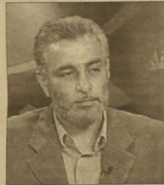
«Ալ Ղաիդային» օգնած լիցենզիա սեղանակալը դատապարտվել է նաև 17 այլ անձինք 6-11 տարեկան ազատազրկման:

Թաբաթի 11-ի ահաբեկչություններից հետո նա վերադարձել է Թաբաթ՝ «Ալ Չազիրայի» նստավայրը: 2003 թ. Բաղդադում նա գրասենյակը գնդակոծվել է իրաքի ռազմաբարձր ժամանակ: Նույն տարեկան սեպտեմբերին «Ալ Չազիրայի» գրասենյակի բացման նպատակով գործուղվել է հայտնի, որտեղ էլ մեքսիկացիները: