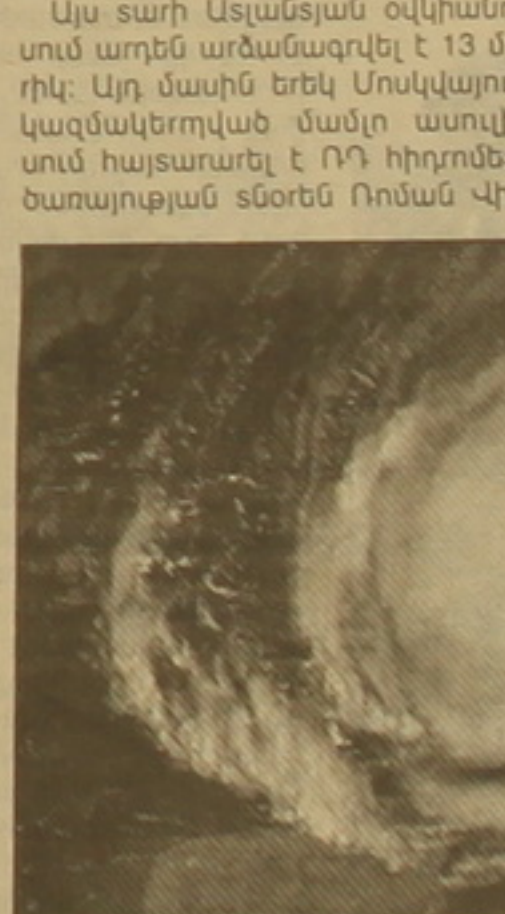
Այս սարի Ալաուդին օվկիանոսում առեւ արձանագրվել է 13 մրիկ: Այդ մասին երկ Մոսկվայում կազմակերպված մամուլի ասուլիսում հայտարարել է ՌԴ հիդրոմետ-ծառայության սնօրեն Ռոման Վի-

ժովամորիկների սարեզանը, որոշեւ կամոն, ավարվում է նույնների 30-ին՝ կառված Համաշխարհային օվկիանոսում ջերմաստիճանի նվազման հետ: Վիլհելմի խոսքերը մեջբերելով ՌԻԱ զործակալու-