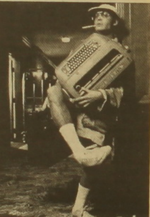
«Վախն ու սեղությունը Լաս Վեգասում»: Դեփի կերպարանավորությունը անձանաչելիության աստիճանի

ինչպես է արված: Զեմ կարծում, թե «Մադոննայի» աշխատող մարդիկ համարողներն են ուսում: Նույն էլ իմ դեմքում է: Ասում են, թե ժամանակին դուր Լեոնարդո դի Կապրոյին խաղընկեր երբեք եւ ինչն է սանջում Գիլյերթ Գրեյվին» ֆիլմում: - Մի անգի երիտասարդ դերասաններ կային իմ կրսեր եղբոր դերի համար, եւ ռեժիսոր Լասե Զալսթրյունն ու ես ընտրեցինք Լեոնարդոյին: Այժմ դու՞ք սեսվում եք: - Ժամանակ առ ժամանակ, երբ հանդիպում եմ ինչ-որ սեղ: Ինչ խորհուրդ կայի՞ք նրան: - Նա լավ տղա է: Ես նրան կասեի. «Մրա այն, ինչ իրո՞ւ ուզում ես: Մի խաղա ուրիշ կանոններով: Եթե եզանց ակնկալում եմ, որ աջ թեկվես, ամբողջ թափով ձայն գնա»: Իսկ եթե Թիմ Բարթոնը ձեզ կանչի Գերմար խաղալու: