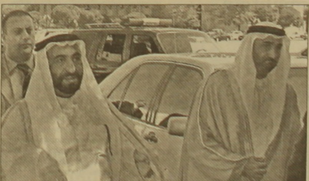
Մուսթաֆա բեն Մուհամմադ ալ Կասիմը Հայաստանում

Արտգործնախարարության մամուլի եւ տեղեկատվության վարչության հաղորդագրությունից տեղեկացանք, որ Արաբական Միացյալ Էմիրությունների բարձրագույն խորհրդի անդամ, Երդողանի Մուսթաֆա բեն Մուհամմադ ալ Կասիմին սեպտեմբերի 19-21-ին ղազախստանի այցով ժամանել է Հայաստան: Այդ ընթացքում էմիրը հանդիպումներ կունենա նախագահ Զոհրաբյանի եւ վարչապետ Մարգարյանի հետ, կայցելի Մեծ եղեռնի հուշահամալիր, Հայաստանի ազգային թանկարան, Երեւանի ղազախստանի համալսարան, Գիտությունների ազգային ակադեմիա եւ Մասեճադարան: Նախատեսվում են այցելություններ նաեւ ծիարավարան, Սեւան եւ Դիլիջան: