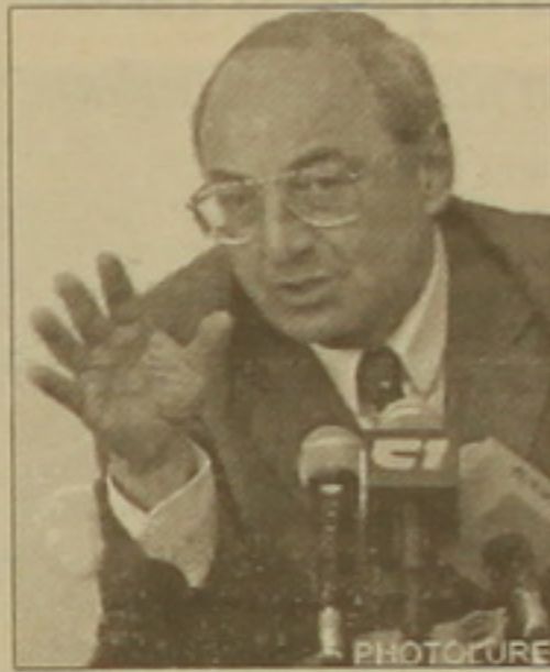
Վազգեն Մանուկյանը դա առաջնային չի համարում, դայաբար կառաջարկի առաջնորդներ։

Իսկ թե ո՞ւմ, ո՞ր առաջնորդների շուրջը ղեկ է միավորվի ժողովուրդը՝ Մանուկյանը դա առաջնային չի համարում, դայաբար կառաջարկի առաջնորդներ։